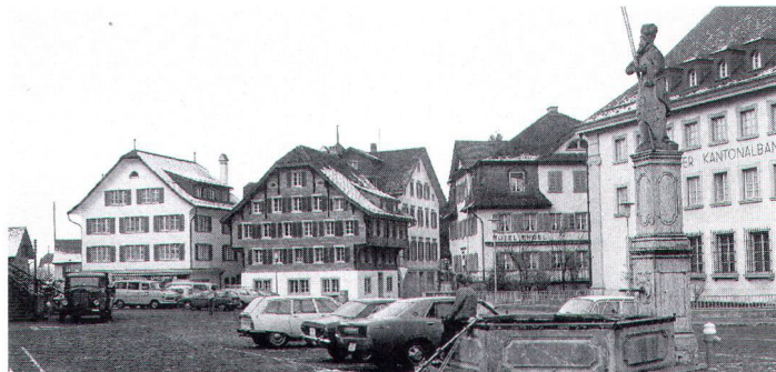
Historischer Platz in Stans NW, der von einem Neubauvorhaben bedroht ist.

In Obwalden zählen dazu ein «Flecken» (Sarnen), zwei «verstädterte Dörfer» (Lungern, Sachseln), zwei «Weiler» (Obsee, Ramersberg) und drei «Spezialfälle» (Flüeli-Ranft, Kirchhofen, Rudenz). Demgegenüber finden sich in Nidwalden ein «Flecken» (Stans), zwei «verstädterte Dörfer» (Beckenried, Buochs), drei «Weiler» (Chappelendorf, Kehrsiten, Ridli) und ein «Spezialfall» (Bürgenstock). Wie in andern voralpinen, streusiedlungsreichen Kantonen fehlen in beiden Kantonen die Städte, dafür sind sie reich an sakral geprägten Kleinstortsbildern. Die grösseren Dörfer sind entweder nach der zweiten Hälfte des 19. Jahrhunderts verstädtert oder in unserer Zeit verbaut worden. Neben den Objekten von nationaler Bedeutung enthält das neue ISOS-Werk auch eine allgemeine Dokumentation über sämtliche inventarisierten Ortschaften, nämlich 19 in Obwalden und 21 in Nidwalden.