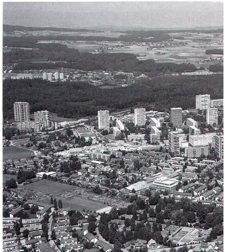
Soll die Wohnqualität nicht beeinträchtigt werden, bestehen auch in den Berner Randgebieten – hier Bethlehem – kaum nennenswerte Verdichtungskapazitäten

Zum Wohnflächenwachstum gibt es ähnliche Argumente. Die detaillierte Überprüfung der Nutzungsreserven innerhalb der bestehenden Siedlungsgrenzen Berns zeigt, dass kaum nennenswerte bauliche Verdichtungskapazitäten bestehen, sofern die Wohnqualität nicht nachhaltig beeinträchtigt werden soll. Wenn die Abwanderung der Bevölkerung in die Region nicht im gleichen Masse wie in den vergangenen 20 Jahren erfolgen soll, wenn kein Konsens zwischen Regionsgemeinden und Kernstadt hinsichtlich des Lastenausgleichs möglich ist und wenn ein Gleichgewicht zwischen Wohnen und Arbeiten innerhalb der Grenzen der Stadt Bern selber als erstre-