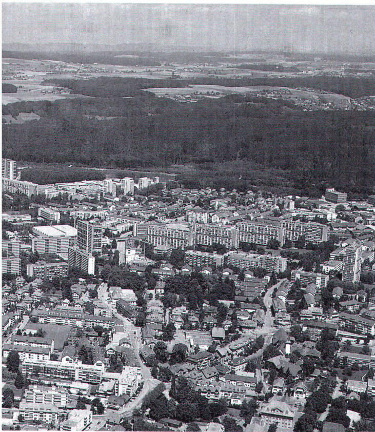
Même à la périphérie de Berne – ici Bethlehem –, les possibilités de densification n'existent guère si l'on veut ménager la qualité de la vie.

4. Il peut y avoir contradiction entre les «manifestations écologistes» ponctuelles et la politique écologique générale d'une ville. Par exemple, l'opposition à un projet de construction de logements dans un centre urbain peut paraître justifiée; mais s'il s'agit d'utiliser un quartier d'habitation bien relié aux transports publics, que cela ménage le site environnant et évite des infrastructures supplémentaires (routes), l'opposition revient à compromettre de façon irresponsable une politique d'ensemble.