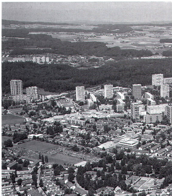
Soll die Wohnqualität nicht beeinträchtigt werden, bestehen auch in den Berner Randgebieten – hier Bethlehem – kaum nennenswerte Verdichtungskapazitäten

Zum Wohnflächenwachstum gibt es ähnliche Argumente. Die detaillierte Überprüfung der Nutzungsreserven innerhalb der bestehenden Siedlungsgrenzen Berns zeigt, dass kaum nennenswerte bauliche Verdichtungskapazitäten bestehen, sofern die Wohnqualität nicht nachhaltig beeinträchtigt werden soll. Wenn die Abwanderung der Bevölkerung in die Region nicht im gleichen Masse wie in den vergangenen 20 Jahren erfolgen soll, wenn kein Konsens zwischen Regionsgemeinden und Kernstadt hinsichtlich des Lastenausgleichs möglich ist und wenn ein Gleichgewicht zwischen Wohnen und Arbeiten innerhalb der Grenzen der Stadt Bern selber als erstre-