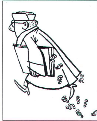
Illustration von Ernst Hürlimann aus «Juristen lachen»

Natur- und Heimatschutzes trotz gelegentlichen Unkenrufen von vereinzelt ewiggestrigen «Volks»- und anderen Interessenvertretern nicht mehr wegzudenken ist.