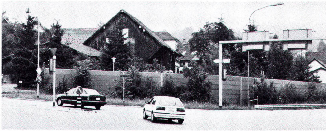
Schutzwände können besonders alte Ortskerne empfindlich stören. Les murs antibruit peuvent altérer gravement les centres historiques.