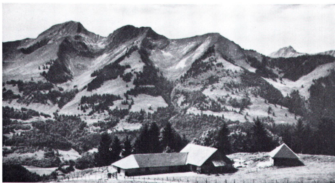
Paysage suisse typique, en Gruyère.

Charakteristische Schweizer Bilderbuch-Landschaft im Greyerzerland.