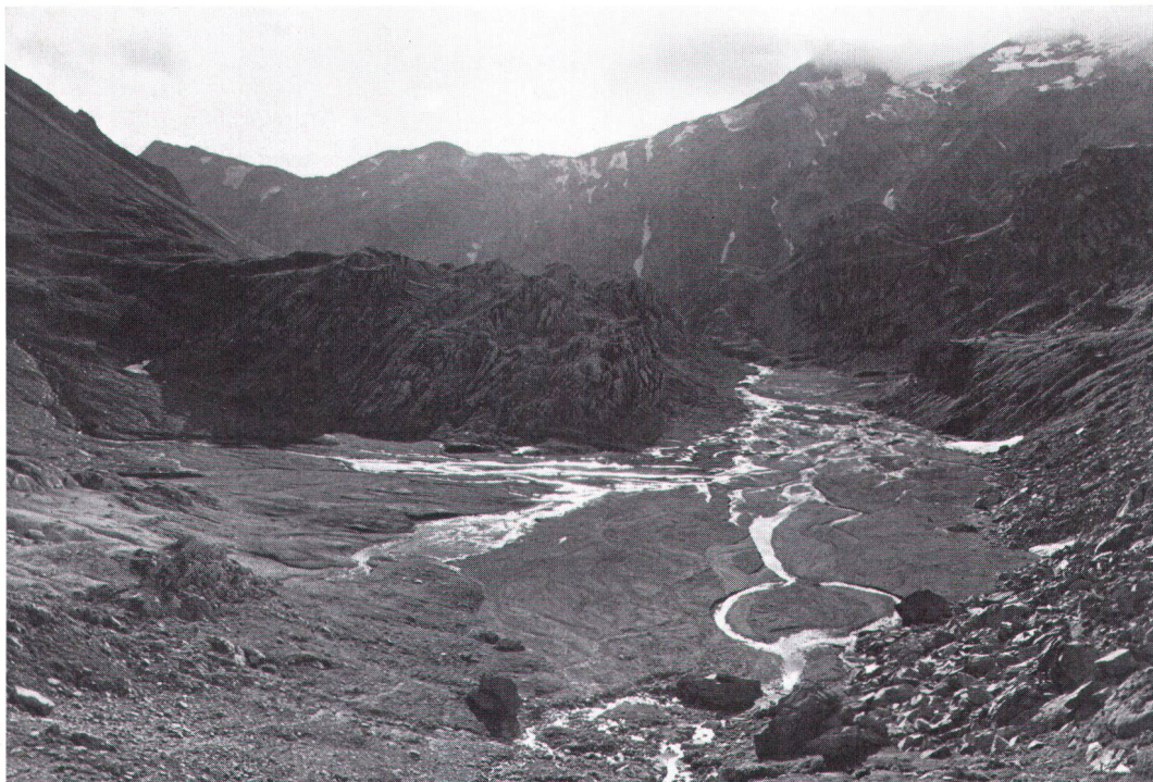
Mit einem nationalen Landschaftsschutz-Fonds, über den im Bundesjubiläumsjahr entschieden wird, sollen inskünftig Ausgleichsleistungen für Nutzungsverzichte «à la Greina» erbracht werden. Grâce au fonds pour la protection du paysage sur lequel les autorités se prononceront en 1991, des indemnités compensatoires seront désormais versées aux Communes qui renonceront (comme dans le cas de la Greina) à des redevances pour ménager de beaux paysages.

Und als dritten Schwerpunkt in der Arbeit des Landschaftsschutzes allgemein, aber auch der SL, sehe ich eine qualitative Verbesserung des Beschwerdewesens . Ich möchte das kurz erläutern und begründen. Die Haltung ist weit verbreitet, eine verwaltungsgerichtliche Beschwerde in Sachen Ökologie habe etwas mit einer ideologisch motivierten Obstruktionspolitik zu tun. Es mag sein, dass fundamentalistische grüne Forderungen oder Be-