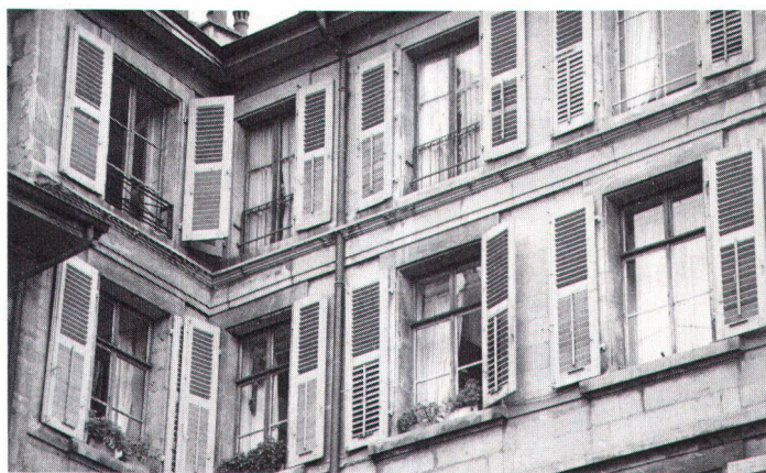
Fenêtres à verre simple dans une façade du Vieux-Genève. Fenster mit Einfachverglasung in einer Fassade der Genfer Altstadt.

Si les grandes baies en verre ont contribué de façon décisive à l'apparition de nouvelles formes d'architecture, la question de l'isolation thermique et phonique des surfaces vitrées subsistait. L'évolution des techniques permettra, principalement après la Seconde Guerre mondiale, de donner réponse à ces problèmes. Le verre double (de type thermo-pane ), enchâssé dans un cadre métallique, permet peu à peu d'améliorer notablement les qualités du verre en tant que