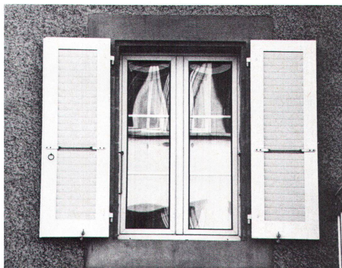
Les reflets font «disparaître» les croisillons et la fenêtre perd beaucoup de son caractère. Durch die Reflektierung «verschwinden» die Sprossen und verliert das Fenster viel von seinem Charakter.

Lorsqu'on parle de la conservation du patrimoine architectural, on considère généralement qu'il s'agit de protéger les «vieilles pierres». Il n'en reste pas moins que les autres éléments à prendre en considération lorsqu'un effort de restauration est entrepris sont également importants: il en va ainsi des crépis, des matériaux de couverture, des menuiseries et en particulier des fenêtres.