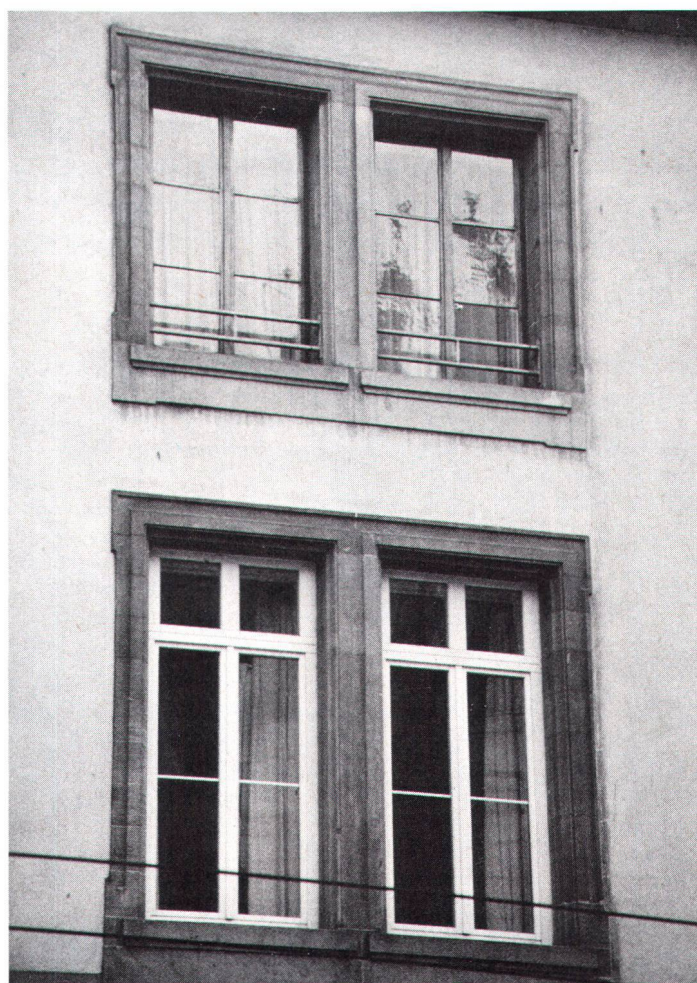
Fenêtres à verre isolant et croisillons factices (en bas); comparer avec l'ancienne fenêtre du haut. Fenster mit Isolierscheiben und falschen Sprossen (unten) im Vergleich mit den ursprünglichen.