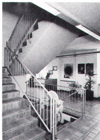
Cage d'escalier avec ascenseur pour handicapés.

On a placé au rez-de-chaussée les locaux spéciaux: atelier, cuisine, salle commune, et à l'étage quatre salles de classes, une salle de logopédie et le bureau directorial. L'aspect extérieur du bâtiment principal et de ses annexes a été autant que possible conservé, et les alentours bénéficient d'une nouvelle disposition, avec une claire séparation des domaines public et privé. Le premier comprend les accès et le parc à voitures, et le second, où les enfants peuvent jouer, comprend une grande halle couverte construite en style moderne, des pelouses, un jardin potager et un jardin d'agrément. Du point de vue architectural, cette ancienne fabrique a permis de faire une installation tout à fait satisfaisante.