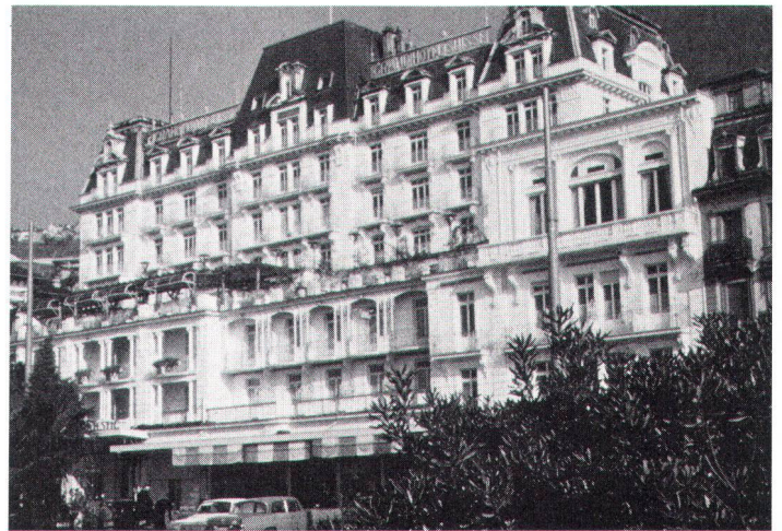
Symbole d'une élite touristique: l'hôtel Suisse. Symbol touristischer Noblesse: Das Hotel Suisse.

Treppenhaus mit Treppenlift für Behinderte.