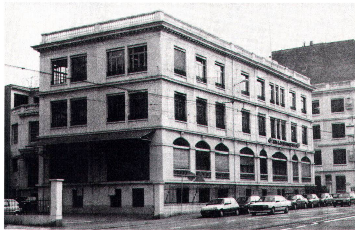
L'ancienne fabrique de tabac Laurens abrite maintenant des bureaux.

Les activités qui se sont implantées dans d'anciennes fa-