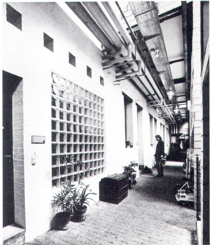
Wohnungsbereich im ehemaligen Eisenwerk Frauenfeld.

Man kann solche Veränderungen besonders in einem so repräsentativen Quartier wie die Rade bedauern, wo die Banken und Versicherungen schon jetzt mehr als genug vertreten sind. Aber bis heute fehlen die gesetzlichen Möglichkeiten, um unerwünschte Umnutzungen zu verhindern. Auf der andern Seite kann die Mehrheit alter Fabrikanlagen – wenn sorgfältig vollzogen – gut neuen Bestimmungen zugeführt werden.