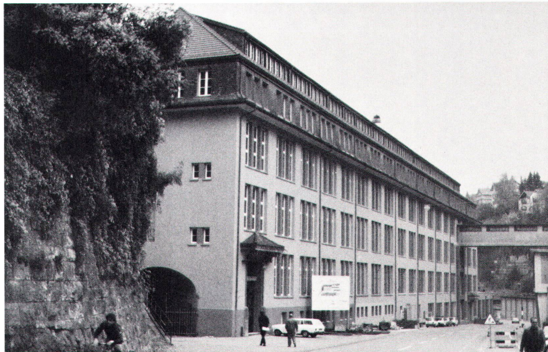
Westfassade des zum Gewerbezentrum umgestalteten ehemaligen Werkgebäudes der Georg Fischer AG in Schaffhausen.

Die anfängliche Faszination ist schnell der sachlichen Problemstellung gewichen, wie das rund 120 m lange, 16,6 m tiefe und an seiner höchsten Stelle über 33 m hohe Gebäude den zukünftigen Gewerbetreibenden optimal zugänglich gemacht wird, sowie vernünftige Unterteilungen auch in kleine-