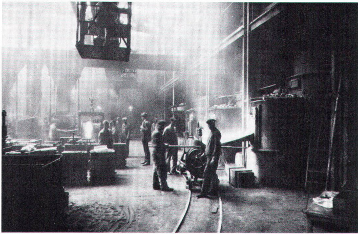
Stimmungsbild vom alten Giessereibetrieb im Mühletal.