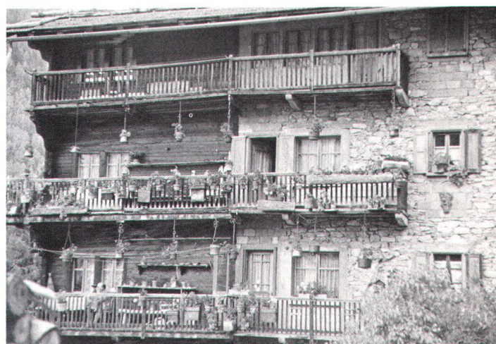
Jadis, la nature fournissait seule les matériaux de construction. Einst lieferte allein die Natur die Baustoffe

Si, actuellement, certaines maladies sont mises en relation avec des matériaux toxiques ou des techniques de construction, cela doit attirer l'attention des intéressés; et ils seront bien avisés, à longue échéance, de prendre au sérieux les nouvelles connaissances en la matière aussi bien que les incertitudes et les craintes que cela suscite, et de remédier aux situations insatisfaisantes. Mais, en dépit des dangers qui résultent de l'accroissement des produits chimiques dans la construction, on ne peut pas nier les progrès réalisés par la construction moderne au bénéfice de la santé publique. Aurions-nous oublié que beaucoup de maux