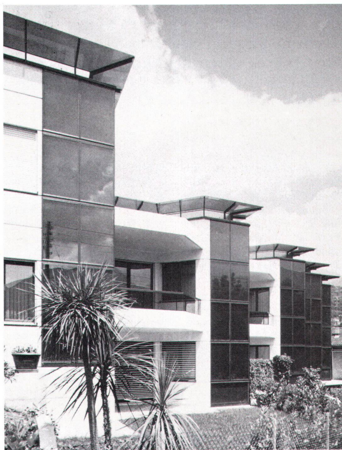
La révolution technique a fait surgir de plus en plus de matériaux artificiels.

Personne ne regrette de telles conditions de vie, comme en témoigne déjà le fait que des quartiers entiers de vieilles villes sont maintenant assainis et pourvus du confort moderne. Nos maisons, d'autre part, ne sont pas seulement devenues plus sûres: on est aussi arrivé à les mieux protéger contre les intempéries et à les équiper d'un confort dont bien peu de personnes aimeraient se passer. Il n'en est pas moins certain que ces améliorations ont dû se payer et se paient toujours. En réduire les inconvénients, eu égard à l'écosystème et à la santé humaine, est une tâche d'avenir à laquelle la recherche scientifique, et encore moins la branche du bâtiment, ne peuvent se soustraire. Cette tâche est un défi qui ne saurait être laissé à quelques groupements marginaux, mais exige une collaboration interdisciplinaire, sur un large front. De cela, nous sommes encore bien éloignés. Marco Badilatti