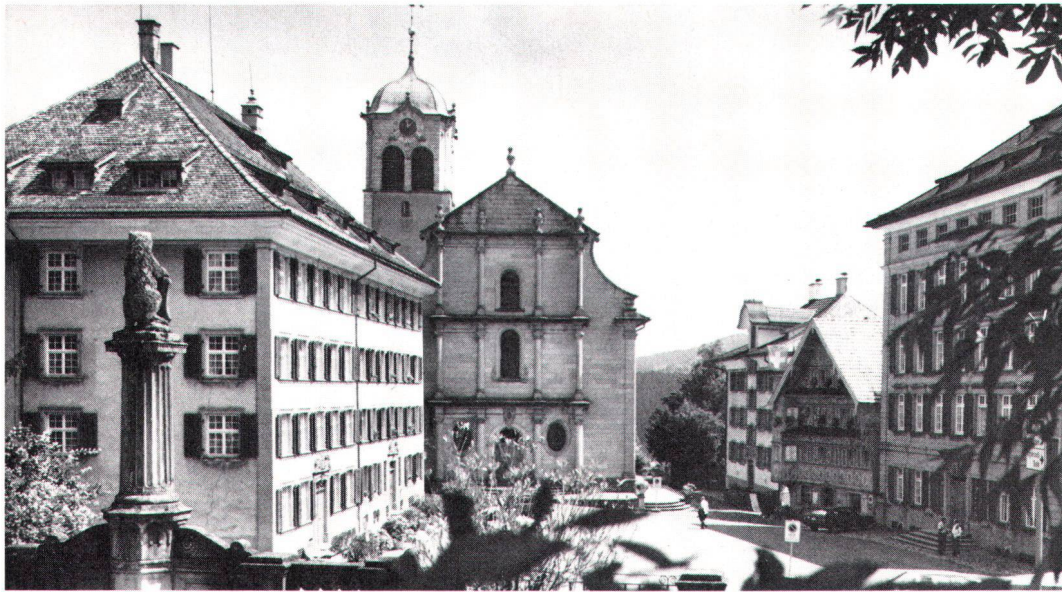
Der Landsgemeindeplatz mit den «Palästen» der Familie Zellweger und der Grubenmann-Kirche von 1782 (Bild Wolf).