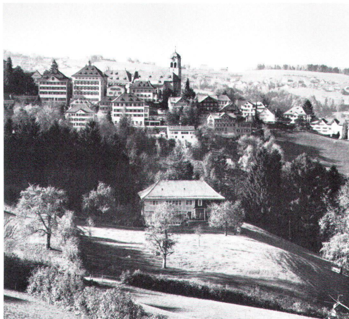
Blick auf Trogen von Osten. Vue de l'est sur Trogen.

Ces prochains jours va commencer dans toute la Suisse la vente de l'Ecu d'or pour la protection du patrimoine et de la nature. Son objectif principal est, cette année, la commune appenzelloise de Trogen: une partie du produit de la collecte alimentera un fonds qui permettra d'aider à la restauration de nombreux édifices. Faisons un peu connaissance avec Trogen.