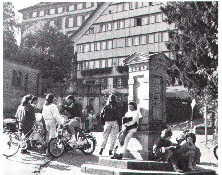
Schüler der Kantonsschule, der Primarschule und des Pestalozzidorfes bevölkern den Dorfplatz. Das Mädchenkonvikt, ein altes Holzgiebelhaus, schmückt auch den Schoggitaler.

Die Zellweger in ihrer Ehre verletzt, konzentrierten nun ihre ganze Kraft in den Leinwandhandel, gründeten Filialen in Lyon , Marseille , Genua , Barcelona und zählten zu den erfolgreichsten Kaufleuten der Ostschweiz. Warum sollten sie