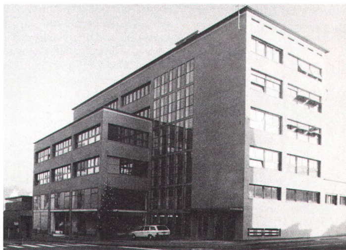
Das renovierte Verwaltungs- und Werkgebäude der Städtischen Werke Baden (Bild Eppler, Maraini & Partner)

Le bâtiment administratif et pour ateliers rénové par les Travaux publics de Baden.