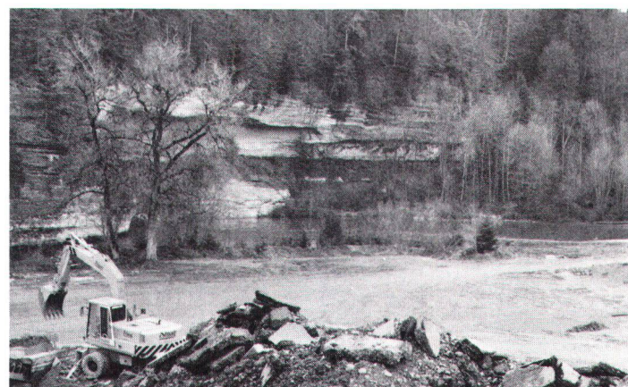
Retraitement de matériaux de construction en zone protégée. Bauschutttaufbereitung in geschützter Zone