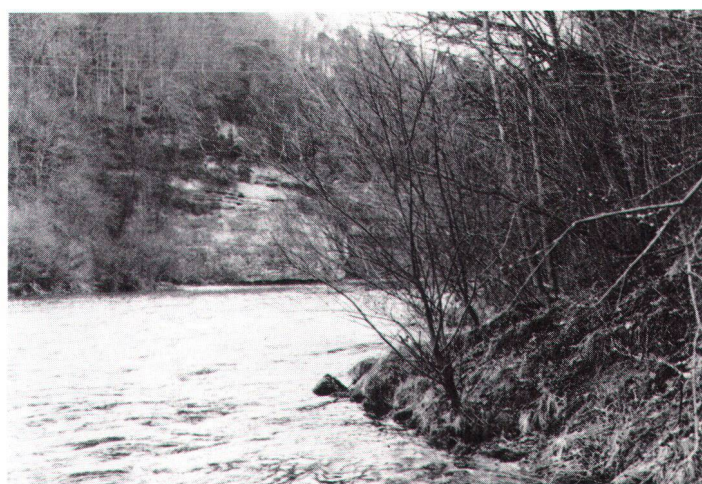
Au bord de la Sarine, près de Posieux. Am Saaneufer bei Posieux

Le Tribunal fédéral a donc annulé l'autorisation de défrichage. Il a jugé que les motifs d'étroitesse du terrain, invoqués par l'exploitante pour justifier la récupération de matériaux usagés au détriment de la forêt, ne sont pas admissibles puisque l'exploitante avait délibérément provoqué, dans un but purement finan-