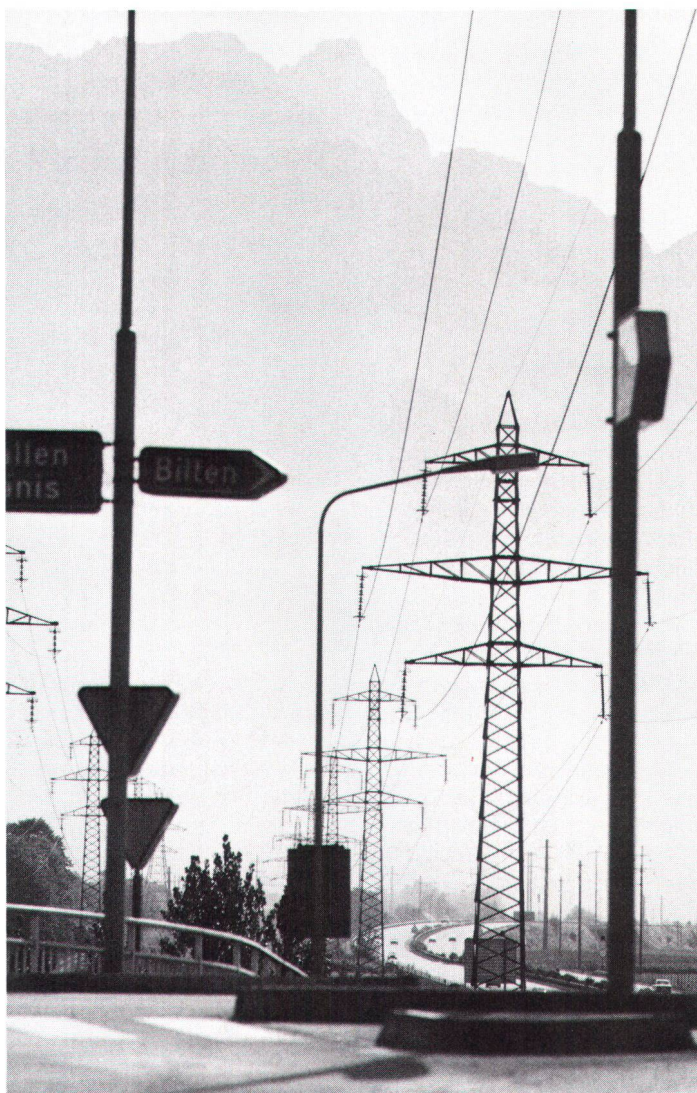
Zeitgenössische «Zivilisationslandschaft» Paysage «civilisé» d'aujourd'hui.