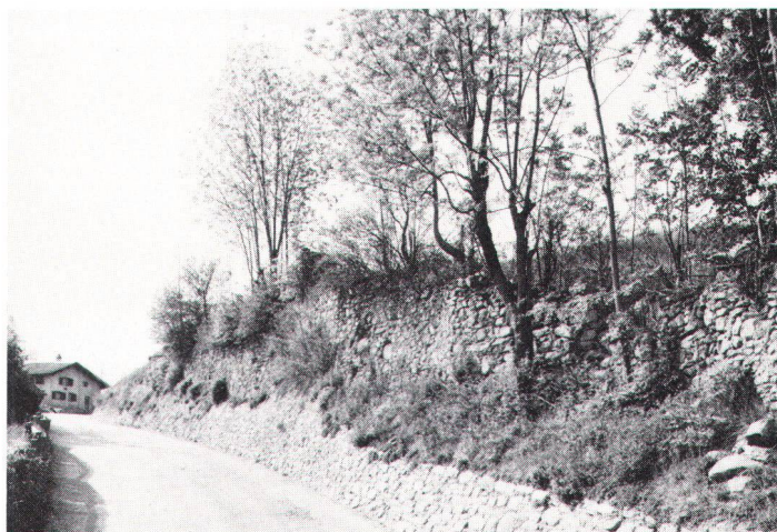
So darf «Ufruume» niemals verstanden werden

Rückbau und Wiedergutmachung kosten Geld. Es kann darum wichtig sein, dass auch der Finanzierung solcher