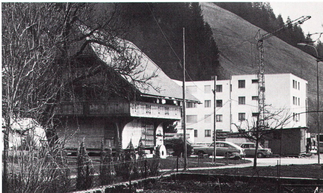
Nichts gegen moderne Architektur, aber...