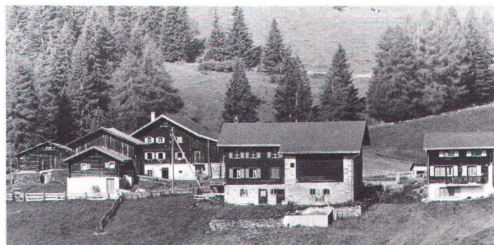
Sporz bei Lenzerheide GR: Einst Scheunen und Ställe, heute Restaurant mit separaten Zimmertrakten

● Il nous faut considérer la protection de bâtiments agricoles comme partie d'une vaste réforme paysanne. L'évolution de la construction non agricole, au village, doit se soumettre à ce mouvement d'ensemble, au lieu que les