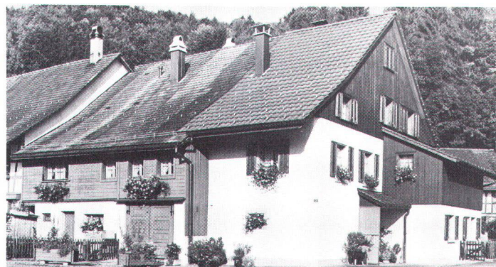
Totale Umnutzungen verändern die Dorfstrukturen und bestimmen die Bodenpreise von morgen Les changements complets d'affectation transforment la structure villageoise et déterminent les prix du sol pour demain.

2. Es darf deshalb nicht sein, dass Bodenpreise oder höhere Bruttorenditen für eine bestimmte Umnutzung die Standortstrukturen der Dörfer vollständig zu bestimmen beginnen. Eine konsequente Ausrichtung der Nutzungen im Dorf nach Massgabe dieses Kapitaldruckes zerstört gerade das Provisorische, Extensive, Freiraumhafte und Improvisierte vieler dörflicher Nutzungen des Bodens und der Bauten. Bestehende Landwirtschaftsbetriebe im Baugebiet wollen einer Landwirtschaftszone (Bauernhofzone) zugeteilt werden. Auch leerstehende, erhaltenswerte Ökonomiebauten sollten in einer Bauernhofzone umgezont werden. 3. Wir empfehlen deshalb, in den Ortsplanungen in dieser Richtung der Vernetzung der bäuerlichen Betriebsstandorte mit dem Ortsbild einerseits und einer stabilen Landschaft