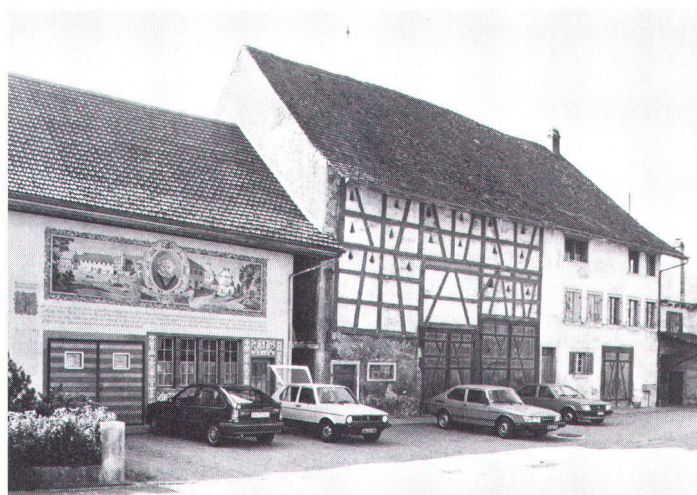
Embrach ZH: Erosion bäuerlicher Strukturen A Embrach ZH: érosion d'une structure architecturale paysanne.

1. Wir müssen die Erhaltung der landwirtschaftlichen Bauten als Teil eines grossen ländlichen Reformwerkes sehen, das einerseits die bauliche Erneuerung der Landwirtschaftsbetriebe in angestammten Strukturen fördert und andererseits auch im Bereich des Kulturlandes einen «Rückbau» einleitet zur Erhaltung