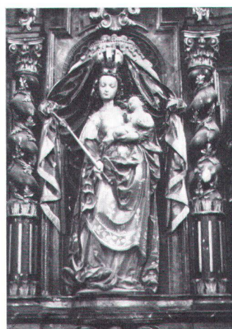
«Madone à l'Enfant», de Jean-François Reyff (1645).

«Madone à l'Enfant» von Jean-François Reyff (1645)