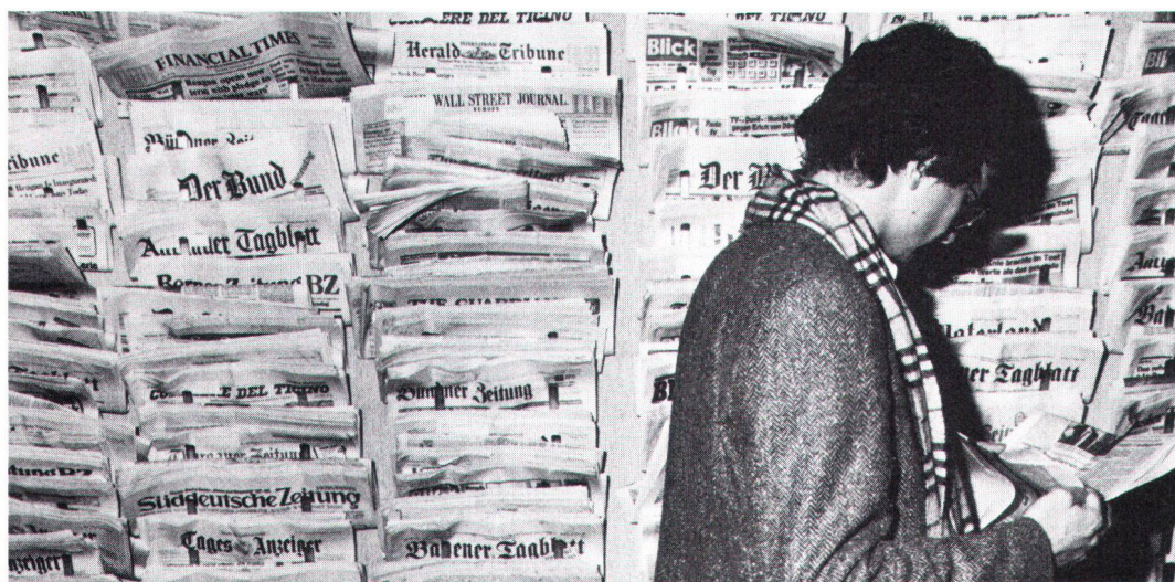
Die Presse, nach wie vor das meistbenutzte Medium (Bild & News).

son implantation régionale. Il faut lui réserver les informations qui nécessitent le complément d'un commentaire. Pour le traitement de questions spéciales de principe, la presse technique et professionnelle peut aussi être très utile et ne doit pas être négligée. D'une façon générale, il est important d'établir des relations personnelles et suivies avec des rédactions et des journalistes sur qui l'on peut compter. Un service d'informations écrites, occasionnelles ou périodiques, est sans doute le moyen le plus utilisé; il va du bref communiqué à l'exposé complet et illustré; les textes doivent être en tout cas concrets, actuels, clairs et aussi brefs que possible. Il ne faut pas abuser des conférences de presse, à réserver pour les cas très importants. Dans certains cas, elles peuvent être avantageusement remplacées par des entretiens, ou des séminaires, auxquels sont invités un petit nombre de journalistes particulièrement intéressés. Avec la radio et la TV, il est recommandé d'être exactement informé sur le but de l'émission et la liste des sujets prévus au programme; il faut préparer soigneusement son intervention, s'exprimer brièvement, et toujours garder son calme.