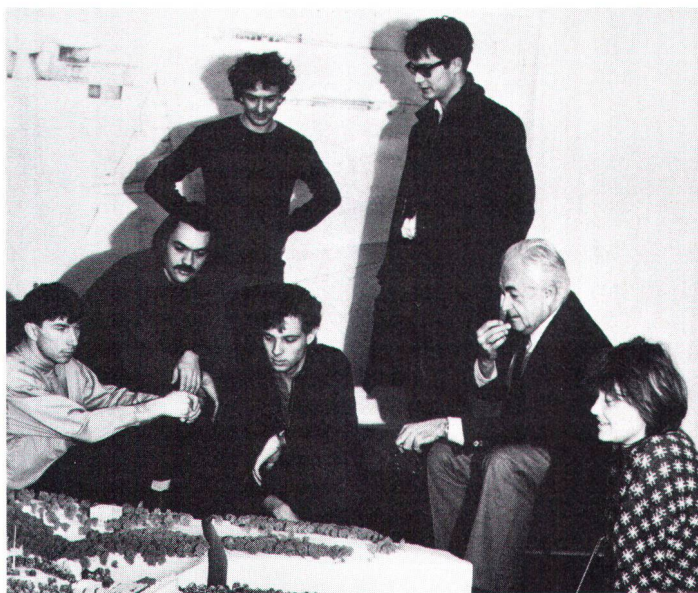
In Zukunft will die ETH nicht nur Normal- und Nachdiplomstudien u. a. für werdende Architekten und Planer anbieten, sondern auch Weiterbildungskurse für bereits Berufstätige. Désormais, le Poly veut offrir, en plus des études ordinaires et des possibilités de diplômes complémentaires (notamment pour de futurs architectes et planistes) des cours de formation continue pour praticiens.

mentaire – notamment pour les ingénieurs du génie civil –, l'étudiant a la possibilité d'établir lui-même son programme, c'est-à-dire qu'il peut choisir des branches où l'on s'occupe principalement des questions d'environnement. Dans le domaine de la formation continue, le Poly a l'intention de faire de gros efforts, ainsi que le montre déjà la création, en novembre dernier, d'un poste de délégué à la formation continue, qui, dans la nouvelle structure du Poly, porte le titre de «prorecteur». Cette formation continue est destinée non seulement aux porteurs d'un diplôme complémentaire, mais aussi à des gens qui, après quelques années de pratique d'une profession, désireraient soit rafraîchir leurs connaissances, soit s'informer de nouveautés apparues dans leur spécialité. Il y a là, pour ce qui concerne la protection du patrimoine, de très intéressantes perspectives. «Je crois qu'on peut dire», a déclaré le recteur du Poly de Zurich au colloque de la LSP, «que notre haute école a été attentive aux signes des temps. Elle n'a pas réagi avec mauvaise humeur, mais a agi avec persévérance dans le cadre de ses possibilités, ce qui ne veut pas dire qu'elle ait été très rapide. J'invite tous nos critiques et amis (l'un n'exclut pas l'autre) à s'informer des vastes possibilités qu'offre notre établissement, et à les utiliser pleinement.»