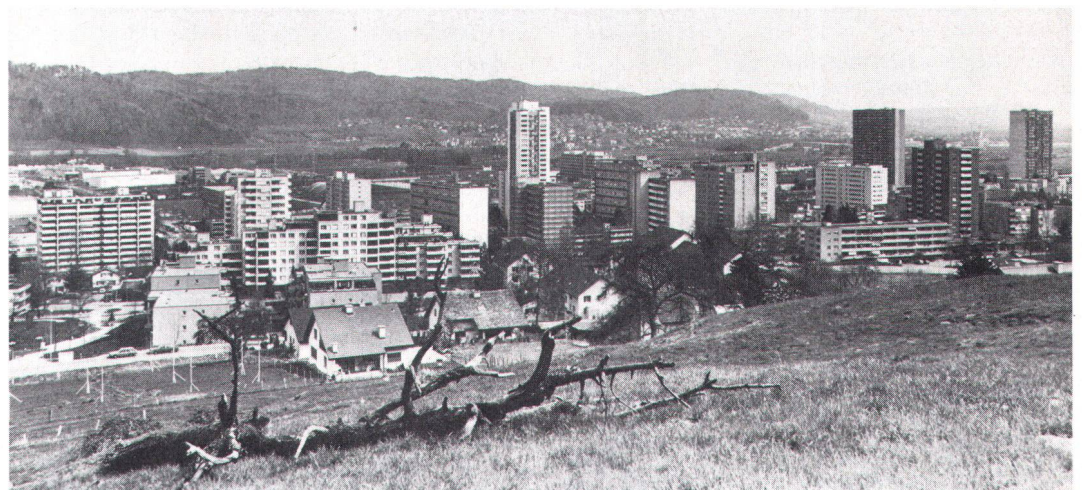
Lineares Wachstum der Baumasse führt zu exponentiellem Anwachsen der Verheerung.

Eine andere These lautet: «Seine Tätigkeit richtet er sowohl auf die Erhaltung bestehender Lebensräume als auch auf die Gestaltung neuer aus.» Die Entstehung der vorhandenen Lebensräume habe ich begriffen. Wo aber finden sich in der Schweiz die zu gestalten den neuen? Wo im Hauptfeld der praktischen Arbeit der Kulturlandschaft hat es noch Platz für neue Lebensräume? Wo in der Agglomeration, die «Schweiz» heisst, kann der Heimatschutz noch gestalten? Im weitem heisst es in den Genfer Thesen: «Er verfolgt