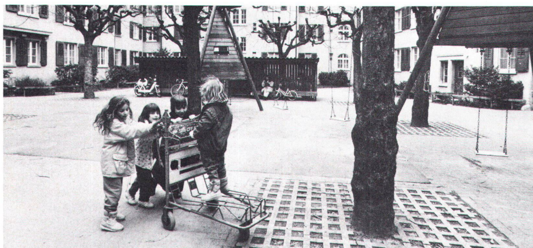
... er muss heute auch dazu beitragen, die verödete Agglomeration in einen lebenswerten Ort umzugestalten.

Damit komme ich endlich zur Sache: Heimatschutz wozu? Wir brauchen Heimatschutz, weil wir in einem radikalen Zeitalter leben. Denn wir können heute nicht einfach etwas mehr von dem erleben, was früher auch schon war, sondern völlig Neues. Quantität hat längst in negative Qualität umgeschlagen. Das Jumbo-Chalet ist eine hybride Züchtung mit Sentimentalität als Mutter und Geldgier als Vater. Es ist gross und hässlich. Stelle ich 100 Chalets auf eine Alp, so habe ich nicht einfach hundert Chalets, sondern alles ist hundertmal hässlicher. Lineares Wachstum der Baumasse führt zu exponentiellem Anwachsen der Verheerung . Spätestens seit der Einführung der Fruchtfolgeflächen ist auch klar, dass die Schweiz voll und die Zeit der Expansion zu Ende ist. Wir haben keine Auswegmöglichkeiten mehr. Und von der Umwelt zu reden, erspare ich dem Leser. Denn er weiss, wir haben nur noch eine Frist. Zusammengefasst: Wer will, dass alles so weitergeht, hilft mit, dass alles so weitergeht. Darum ist Heimatschutz ein Teil des Gesamtprogrammes « Erhaltung der Art » geworden. Wir brau-