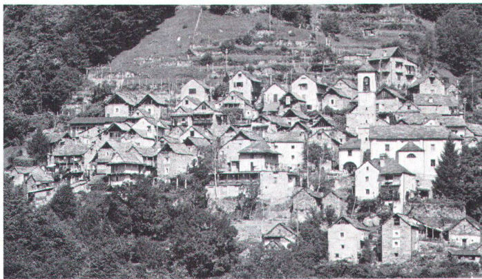
Heimatschutz darf nicht im Bewahren verhaftet bleiben....

eine Strategie des schöpferischen und dynamischen Handelns und setzt sich überall dort abwehrend ein, wo ihm das als nötig erscheint.» Also Heimatschutz als Feuerwehr. Das ist zwar hier nicht so gemeint, aber es ist das, was in Erscheinung tritt. Wir verdanken hier dem Heimatschutz viel. Das schöpferische und dynamische Handeln allerdings gehört sonst doch eher in das Wörterbuch derjenigen, denen der Heimatschutz im Wege ist. Gewiss, auch Bewahren ist Handeln. Nur: welche Dinge gingen über das Bewahren hinaus? In bezug auf seine Kontakte nach aussen sagt der Schweizer Heimatschutz, dass er mit allen Bevölkerungskreisen lebendige Beziehungen suche, besonders aber mit der öffentlichen Hand. Weiter: «Im Vergleich zu den staatlichen Einrichtungen, deren Hauptzweck die Gesetzgebung, der Vollzug und die Subventionsleistung ist, sieht der private Heimatschutz seine Daseinsberechtigung primär in der politischen Meinungsbildung . Er sorgt dafür, diese Aufgabenteilung in der Öffentlichkeit vermehrt bewusst zu machen.» Aha, da haben wir es endlich: der Heimatschutz ist eine Politorganisation, der Heimat eine Lobby, einer ganz besonderen Art von Heimat allerdings, nur der schützenswerten. Und diese Lobbyarbeit