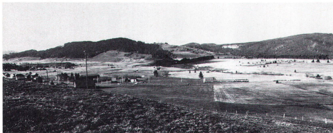
Spätestens seit Rothenthurm wissen wir, dass es verschiedene Arten von Heimatschutz gibt. Nous savons, en tout cas depuis «Rothenthurm», qu'il y a diverses sortes de protection du patrimoine.

Néanmoins, «l'envahissement de la laideur» rapporte beaucoup d'argent et nous en profitons tous. Le lien étroit du profit et de la laideur semble admis comme allant de soi. Nous sommes devenus les nouveaux riches de l'Europe et c'est bien là l'image de notre pays. D'où la contradiction interne du «Heimatschutz», qui s'appelle compromis. Pourtant, la défense du patrimoine est plus que jamais nécessaire parce que nous vivons une époque qui se radicalise. Le développement continu de la construction mène à une croissance exponentielle de l'enlaidissement. Il ne reste plus d'issue possible; et ne parlons pas de l'environnement: chacun sait qu'il ne reste ici qu'un délai. La protection du patri-