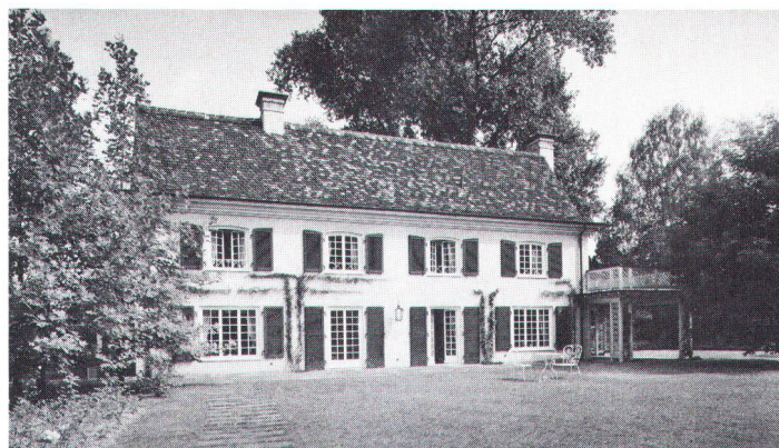
Landhaus in Riehen (Archivbild) Maison de campagne à Riehen

Die untrügliche Stilsicherheit , der seine Werke zeitlose Gültigkeit verdanken, gibt ihm auch den Mut, sich nie dem Diktat der Tagesmode zu beugen und mit seiner Meinung nicht hinter dem Berg zu halten. Anlässlich einer Südamerikareise erschrak er über die Sterilität der neuen Hauptstadt Brasiliens und auf dem Rückweg über die Freud- und Leblosigkeit von Le Corbusiers Hotel N'Gor in Dakar. An der Aurorastrasse , ob dem Sonnenberg in Zürich, schuf