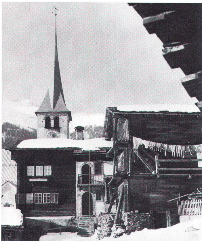
Authentique Valais... Mais, bientôt, seulement dans les prospectus? Unverwechselbares Wallis – bald nur noch in Werbeprospekten? (Im Bild Ernen)

Les affiches et la publicité en faveur du tourisme, en Valais et ailleurs, présentent des paysages vierges et des sites bâtis de qualité, le tout dans un décor féerique de ciel bleu et de montagnes enneigées. Les premiers grands voyageurs dont Goethe ou le peintre anglais Turner, par leur témoignage, ont grandement contribué à l'ouverture de notre canton au tourisme. De nos jours encore l'offre culturelle – sites bâtis, monuments, contenu des musées, témoignages des modes de vie, etc. – est un élément très important parmi les facteurs qui déterminent le choix d'un futur touriste.