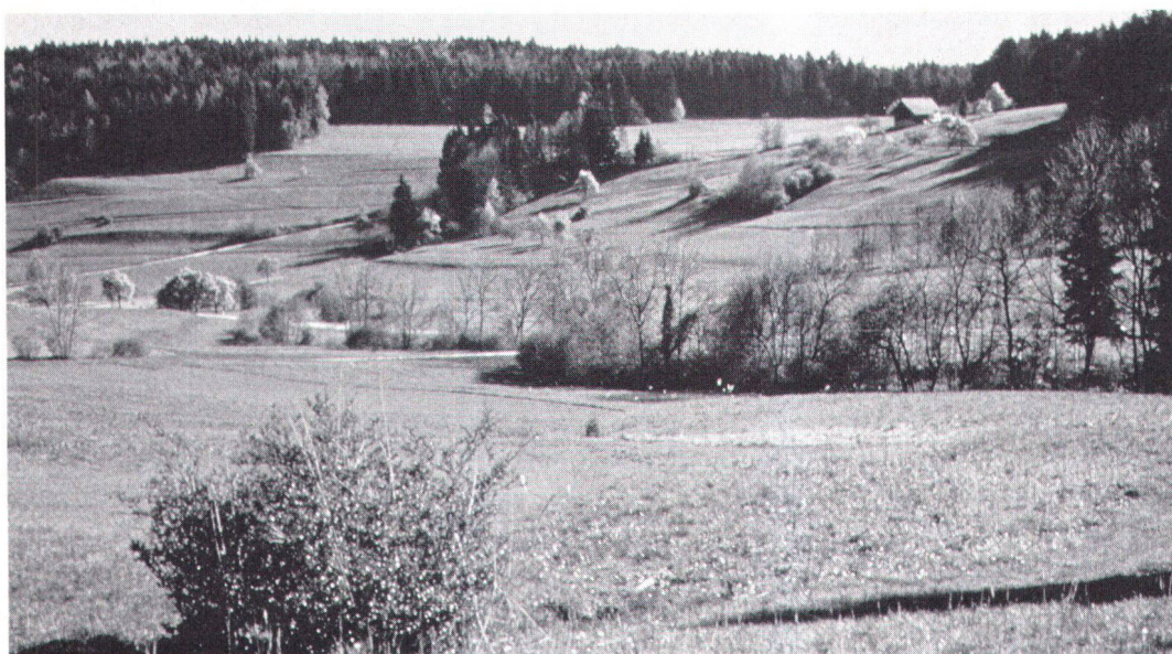
Intakte Landschaften bilden selber die unersetzbare geistige und seelische Grundlage unseres Lebens.

L'envers de notre bien-être matériel réside beaucoup moins dans les risques du nucléaire, par exemple, que dans les modifications climatiques et la combustion de matières fossiles (pétrole, gaz, charbon), et dans l'anéantissement rapide, en Suisse comme dans les pays voisins, des paysages et de conditions de vie encore proches de la nature.»