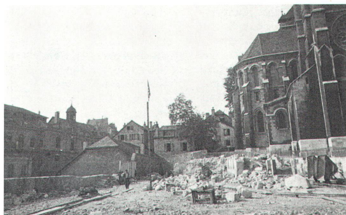
En 1940, un tiers de la vieille ville devait être démoli (photo d'archive).