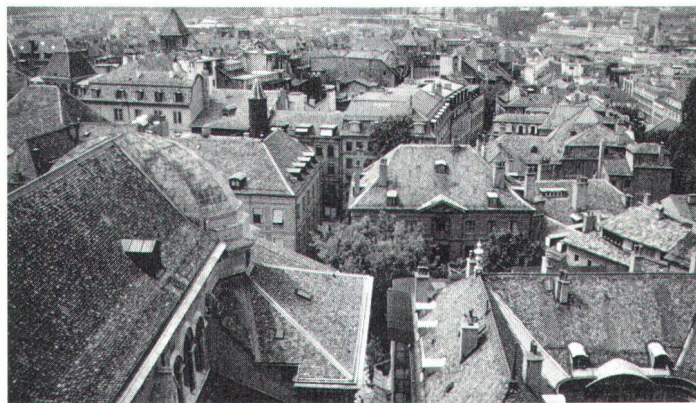
Le fruit d'un bel effort: la vieille ville est maintenant protégée.