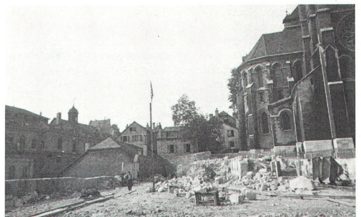
En 1940, un tiers de la vieille ville devait être démoli (photo d'archive).