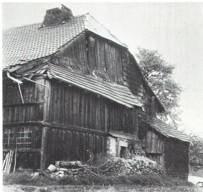
Démoli sans autorisation.... Ohne Bewilligung abgebrochen...

En plus de celui des besoins de son propriétaire , la conservation d'une ferme typique d'une région s'examine du point de vue de l'aménagement du territoire et de celui du patrimoine artistique. Lorsqu'une ferme est isolée sans être intégrée dans une zone à bâtir, le Canton peut autoriser sa transformation ou sa rénovation partielle. Selon la jurisprudence, la transformation est partielle si l'identité d'une construction est conservée ou si la transformation ne crée aucune incidence nouvelle majeure sur le mode d'utili-