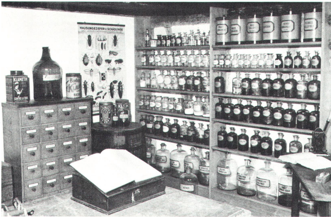
Ende Juni konnte ein Heilkräutergarten mit historischer Drogerie eröffnet werden. A fin juin, un jardin d'herbes médicinales a pu être ouvert, avec sa droguerie à l'ancienne.