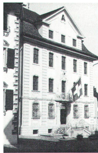
Spätbarocke Fassade des Rathauses von Kaspar Bagnato. Façade de l'hôtel de ville (baroque tardif) de Gaspard Bagnato.