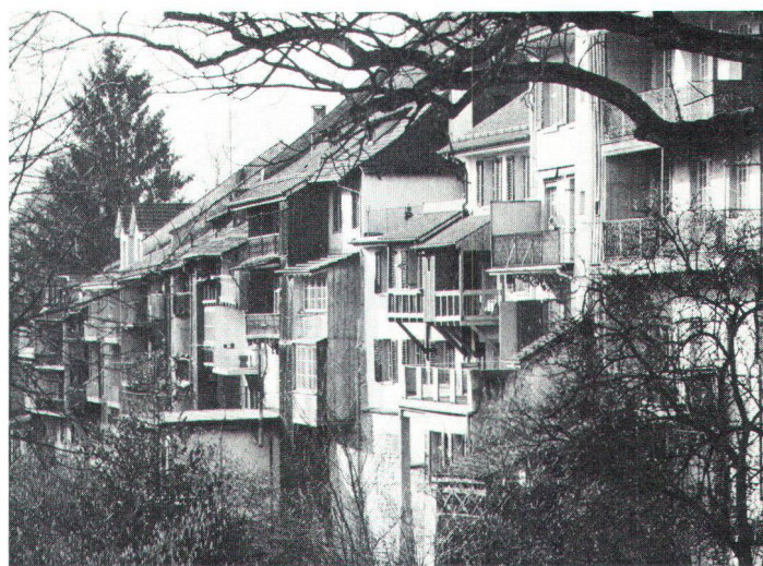
Blick hinter die Altstadtkulisse. Un coin de la vieille ville vue de derrière.