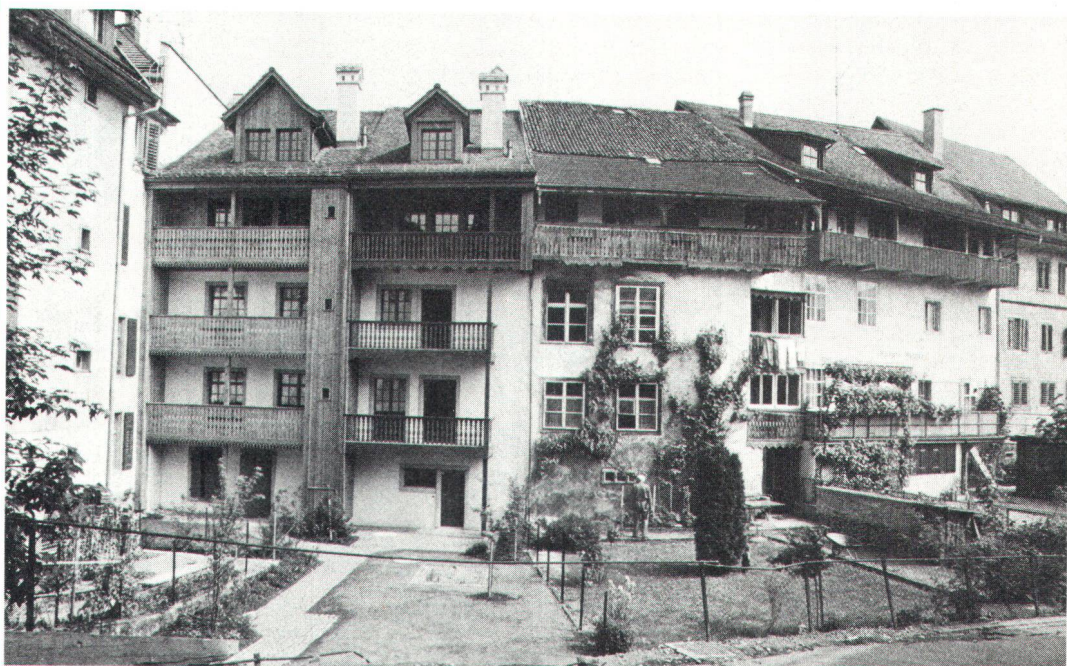
In Bischofszell wird dem Grüngürtel um die Altstadt besondere Beachtung geschenkt. A Bischofszell, on a accordé une attention particulière à la ceinture verte de la vieille ville.

Le cas de Bischofszell est exceptionnel, du fait que ce n'est pas seulement le centre historique qui est protégé, mais aussi les zones qui l'entourent. Telle est la raison essentielle de l'attribution du prix Wakker.