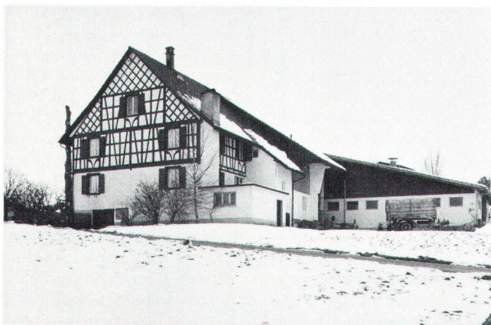
Stallanbauten sind mitunter der einzige Weg, um einen alten Hof am Leben zu erhalten, stellen aber ästhetische Fragen (Bild Stähli). Des bâtiments pour le bétail sont parfois l'unique moyen de laisser subsister une ferme ancienne, mais cela pose des problèmes d'esthétique.

Notre agriculture, jusqu'alors autarcique et stable, a été profondément secouée en quelques dizaines d'années par la motorisation et la mécanisation. Plongée dans l'arène de la concurrence, elle a été obligée de devenir avant tout productive. On a appelé « assainissement » la disparition de nombreuses exploitations petites et moyennes: celles de moins de 20 ha ont diminué en nombre de 49%. Inversement, celles de plus de 20 ha ont doublé leur effectif. Beaucoup ont dû se spécialiser, ce qui a entraîné des changements structurels, une extension des domaines par achats ou locations de terrains, donc une transformation des bâtiments. Le coût élevé de ces transformations et rationalisations (100 000 fr. en moyenne par exploitation) a rendu l'économie agricole étroitement dépendante du rendement et des possibilités de financement. Dans de nombreux cas, les ressources propres des agriculteurs n'étaient pas suffisantes. D'autre part, les nouvelles prescriptions en matière de protection de l'environnement, des eaux, des animaux, des sites, ont encore resserré la marge financière des exploitants, et nécessité le soutien des pouvoirs publics pour le maintien, dans l'intérêt du pays, de la santé économique de l'agriculture. Le soutien des autorités fédérales et cantonales est accordé sous forme de subventions pour les logis et pour la ratio-