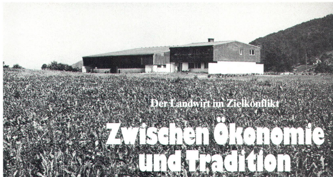
Der Landwirt im Zielkonflikt

Enfin, n'oublions pas de mentionner le «mazot». Situé dans le vignoble, ce petit bâtiment en maçonnerie ou en bois, parfois de construction mixte, n'est, selon les nécessités de son propriétaire, qu'un abri, une petite cave avec ou sans pressoir ou une petite habitation temporaire. Pour les propriétaires venant des villages d'altitude, le mazot permettait de séjourner dans le vignoble pendant les travaux de la vigne et les vendanges. Les Salvaniens, les Bagnards et les Anniards, par exemple, y pressaient le raisin et vinifiaient sur place; d'autres comme les Lensards et les Hérensards préféraient transporter la vendange au village. Voilà la