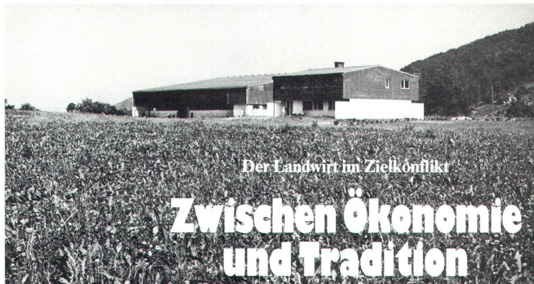
Der Landwirt im Zielkonflikt

Enfin, n'oublions pas de mentionner le «mazot». Situé dans le vignoble, ce petit bâtiment en maçonnerie ou en bois, parfois de construction mixte, n'est, selon les nécessités de son propriétaire, qu'un abri, une petite cave avec ou sans pressoir ou une petite habitation temporaire. Pour les propriétaires venant des villages d'altitude, le mazot permettait de séjourner dans le vignoble pendant les travaux de la vigne et les vendanges. Les Salvaniens, les Bagnards et les Anniards, par exemple, y pressaient le raisin et vinifiaient sur place; d'autres comme les Lensards et les Hérensards préféraient transporter la vendange au village. Voilà la