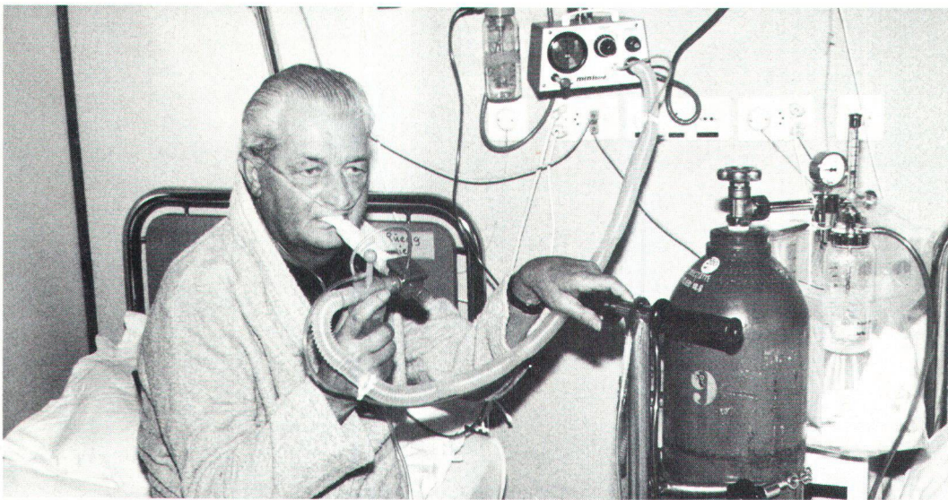
Oxygénation artificielle pour des poumons malades, à la clinique pneumologique Barmelweid. Künstliche Sauerstoffinhalation eines lungengeschädigten Patienten an der pneumologischen Klinik Barmelweid.