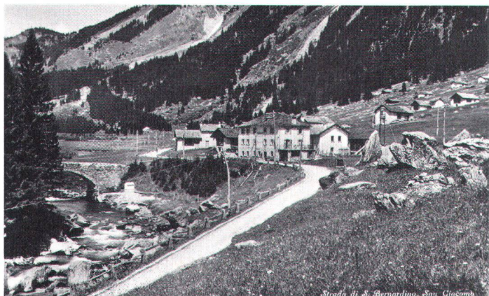
Strada di S. Bernardino. San Giacomo