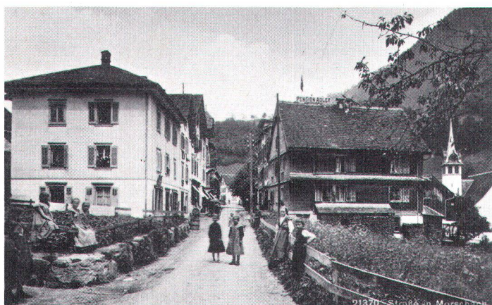
21370 - Straße an Mursbach