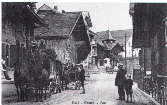
5871 - Gstaad - Post.