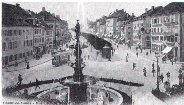
Chaux-de-Fonds - Rue Léopold Zross