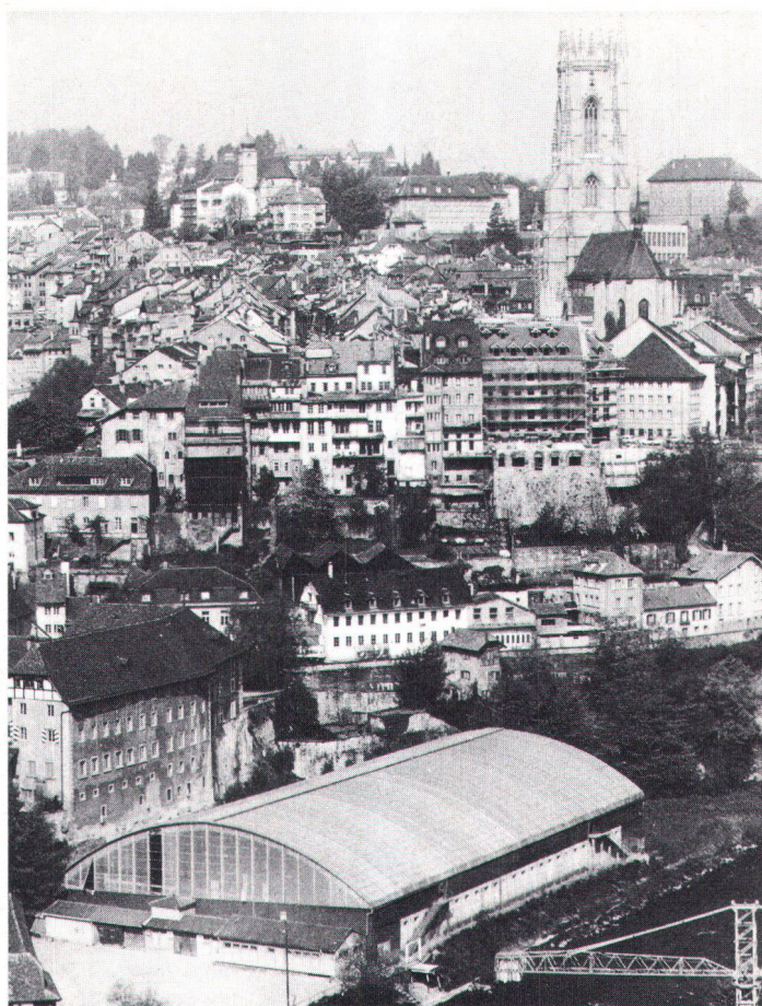
Aus ortsbildschützerischen Gründen glücklicherweise verschwunden: die Freiburger Eishalle

Hier ist daran zu erinnern, dass die räumlichen Folgen von Hallensportanlagen praktisch endgültig und kaum mehr zu beheben sind. Die häufig überproportionierten Bauten beanspruchen den gerade für die Berglandwirtschaft so wichtigen Boden in der Talsohle, wirken preistreibend und fördern damit indirekt auch die Konzentration des Grundeigentums. Und im Mittelland werden solche Anlagen nicht selten in grünen Randzonen erstellt, um dadurch den an sich begreiflichen Forderungen der Sporttreibenden nach Ruhe, sauberer Luft und möglichst viel Natur entgegenzukommen. Bedauerlich daran ist vor allem, dass sich diese Anlagen fast ausnahmslos schlecht in die Landschaft fügen und die Massstäblichkeit der historisch gewachsenen Strukturen sprengen. Zudem handelt es sich hier meistens um reine Zweckbauten aus Fertigele-