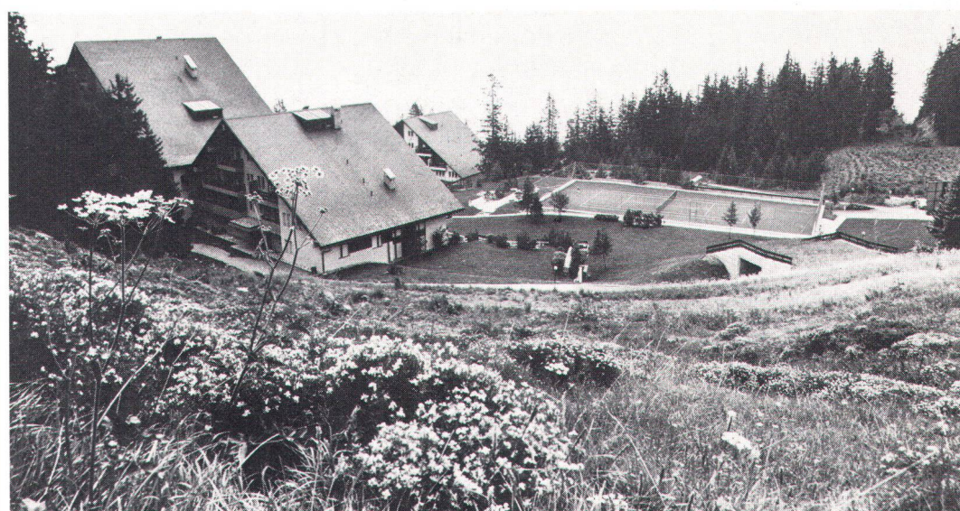
Fürwahr, ein landschaftsraubender und kostspieliger Sport! Von oben nach unten: Tennis-, Squash- und Badehallen in Wilderswil BE und Pfäffikon ZH sowie privater Tennisplatz in den Alpen (Bilder Stähli)

Le sport est décidément coûteux, et catastrophique pour le paysage! De haut en bas: tennis, squash et piscine couverts à Wilderswil BE et Pfäffikon ZH; tennis privé à la montagne.