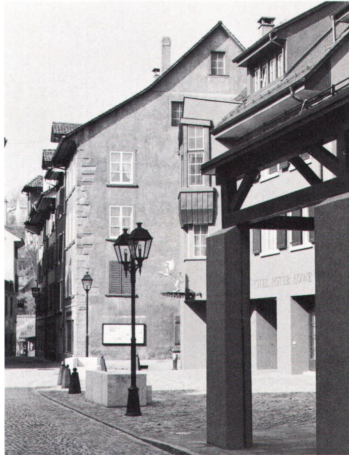
Tragbarer Versuch, neue Architektur mit der bestehenden zu verbinden

Der immer stärker aufkommende Verkehr mit all seinen Nebenwirkungen trägt nicht viel zur Verschönerung des Strassen- und Gassenbildes bei, im Gegenteil. Die Wohnlichkeit einer Altstadt läuft Gefahr, verloren zu gehen. Mit Zonenplan und guten Bau- und Gestaltungsvorschriften verankert in der Bauordnung allein helfen wenig, den schlechten Zustand zu verbessern. In Laufenbourg hat man deshalb mittels Richtplänen «die Ausgestaltung und Benützung der privaten und öffentlichen Freiräume» näher umschrieben. So wurde ein Leitbild über private Vorgärten und Plätze, über öffentliche Grünanlagen und schliesslich über die Gassen und Plätze erstellt. Ziel dieser Richtlinien ist, in jedem Fall die Erhaltung des Altstadtbildes, im weiteren aber ist es die Förderung – der Wohnlichkeit der Altstadtwohnungen (Besonnung,