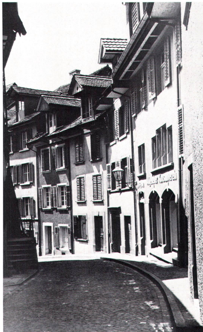
Altstadtromantik ohne perfektionistische Allüren in Laufenburg (Bild Stähli)

Mit einer Wiederholung des 1959 uraufgeführten Tonlichtspiels «Son et lumière» hat Laufenburg AG am 16. Juni die Übernahme des Wakker-Preises 1985 des Schweizer Heimatschutzes (SHS) gefeiert. Welche planerischen Massnahmen nötig waren, um das mittelalterliche Städtchen aber soweit zu bringen, zeigt der folgende Beitrag.