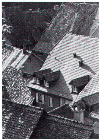
Sämtliche Freileitungen wurden verkabelt... Toutes les lignes électriques ont été enterrées...

Weisungen über die Gebäudehöhe und Dachgestaltung, Dachraumnutzung, Dachaufbauten, Fassadengestaltung, Gestaltung von Fassadenteilen inkl. deren Materialwahl und Farbgebung, Reklamen und deren Einrichtung.