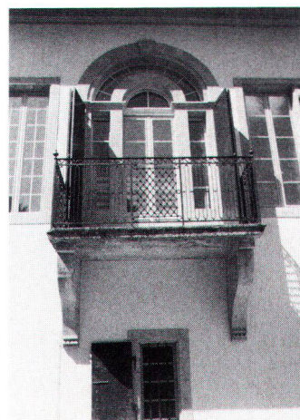
Fenêtre serlienne (du nom de l'architecte Serlio 1475–1554) de la façade est du manoir de Champ-Pittet.