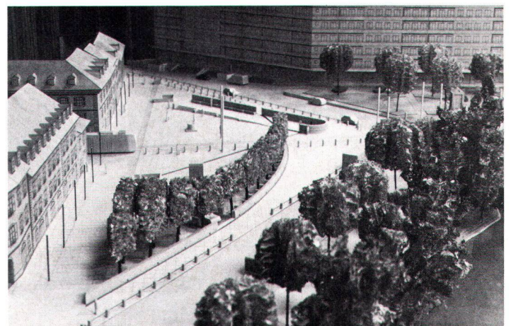
Aménagement de la place de l'Octroi à Carouge. A l'entrée du centre historique protégé, le projet primé (Archambault/Barthassat/Prati, Carouge) propose une plantation d'arbres et la construction d'un mur-tribune.

Bäume und Mauern sollen nach der Vorstellung der Wettbewerbsgewinner Archambault/Barthassat/Prati, Carouge, inskünftig die «Place de l'Octroi» am Eingang zum historischen Kern von Carouge prägen