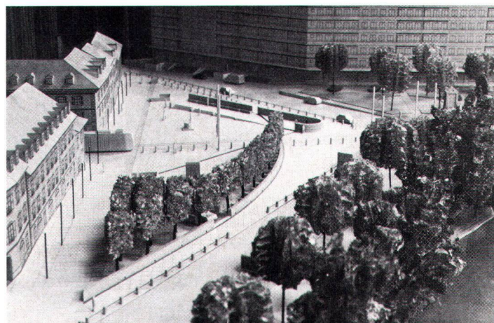
Aménagement de la place de l'Octroi à Carouge. A l'entrée du centre historique protégé, le projet primé (Archambault/Barthassat/Prati, Carouge) propose une plantation d'arbres et la construction d'un mur-tribune.

Bäume und Mauern sollen nach der Vorstellung der Wettbewerbsgewinner Archambault/Barthassat/Prati, Carouge, inskünftig die «Place de l'Octroi» am Eingang zum historischen Kern von Carouge prägen