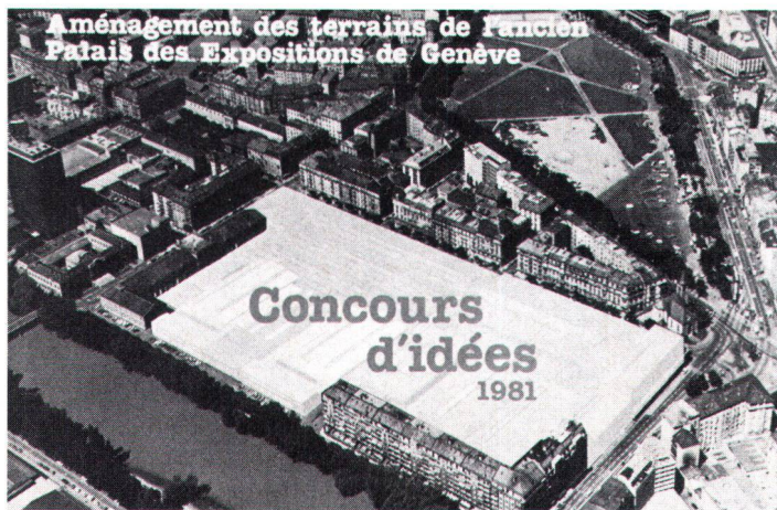
Le concours d'idées pour l'aménagement des terrains de l'ancien Palais des expositions, à Genève, a donné lieu à la publication d'une plaquette qui groupe 61 projets.

Aus dem Ideenwettbewerb für die Neugestaltung des früheren Messegeländes in Genf ist eine Publikation mit 61 Vorschlägen hervorgegangen