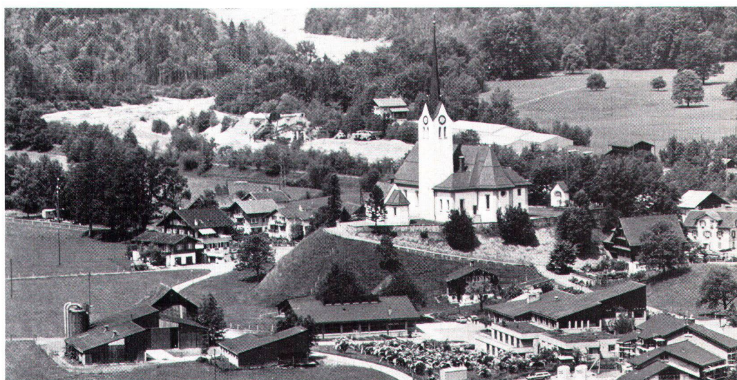
Projekt-Modell und ausgeführte Neubauten der Landw. Schule Giswil OW, die sich feingliedrig der dominierenden Kirche unterordnen und mit dieser eine spannungsvolle Einheit bilden

Maquette (en haut) et bâtiments achevés de l'Ecole d'agriculture de Giswil OW, qui gardent leur rang par rapport à l'église et forment avec elle une remarquable unité.