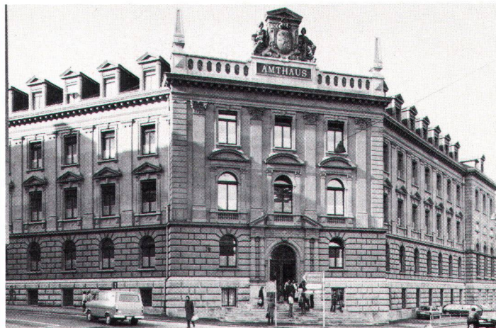
Fassade Amthaus Bern: Gutes Resultat trotz fragwürdiger Zielsetzung des Wettbewerbes (Bild Atelier 5)

«Solchen Architekten (insbesondere jungen, tüchtigen Künstlern), dem Publikum und nicht zuletzt ihrer guten Sache, glaubt die Vereinigung für Heimatschutz einen Dienst zu erweisen, wenn sie es unternimmt, für bestimmte Bauaufgaben Wettbewerbe auszuschreiben und dann durch Veröffentlichungen der besten Entwürfe deren Verfassern die Wege zu ebnen.» So begründete der Schweizer Heimatschutz 1908 seinen Wettbewerb für einfache schweizerische Wohnhäuser. Und wie stellt er sich heute zur Wettbewerbsidee?