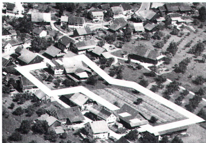
Landwirtschaftsbetrieb mit notwendigem Umschwung innerhalb des Baugebietes, der durch Ausscheiden einer Bauernhofzone vor den rechtlichen Konsequenzen der Bauzone geschützt werden sollte

De tout cela résulte une tendance croissante de ces paysans à vendre leur bien (au prix du terrain à bâtir, naturellement) pour aller s'établir