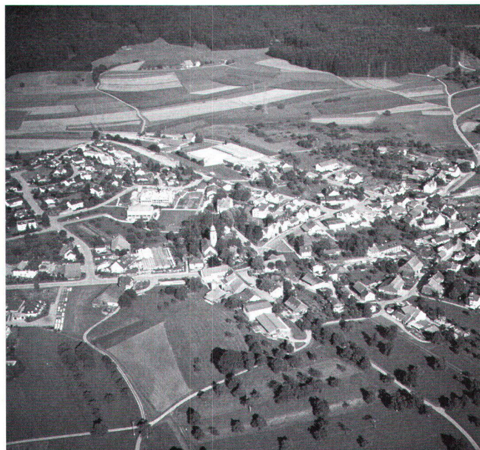
Einfamilienhauszonen erschweren dem Landwirt häufig das Pendeln zwischen Flur und seinem im Baugebiet gelegenen Hof

Das ist jedoch nur möglich, wenn durch detaillierte Bodenkarten diese Flächen zuhanden der Ortsplanungsrevisionen bezeichnet werden können. Die einheitliche Fassung des nicht überbauten Landes ausserhalb der Bauzonen zu einer unterschiedslosen Landwirtschaftszone darf nicht dazu verleiten, die Bodenqualität als überall gleichwertig