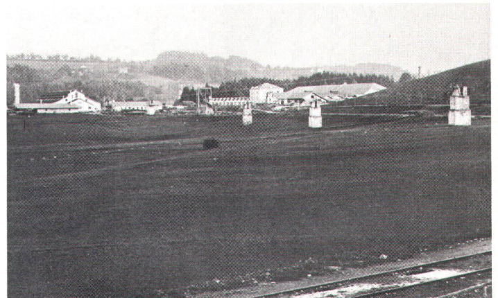
Péroilles FR vers 1875, avec transmission téléodynamique de l'énergie hydraulique.

Wie andere Zweige, wurzelt auch die Uhrenindustrie in der bäuerlichen Heimarbeit (Uhrenatelier im La Sagne-Tal NE um die Jahrhundertwende)