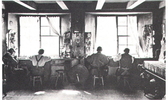
Comme d'autres industries, celle de la montre a pour origine le travail à domicile (atelier de La Sagne NE au début du siècle).

Wie andere Zweige, wurzelt auch die Uhrenindustrie in der bäuerlichen Heimarbeit (Uhrenatelier im La Sagne-Tal NE um die Jahrhundertwende)