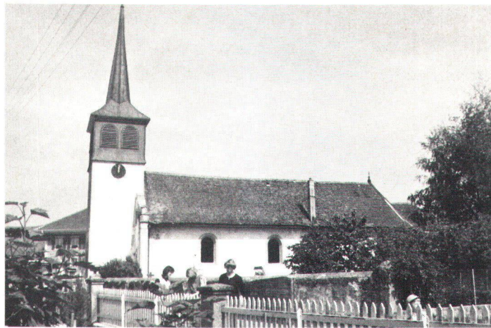
L'église de Villarepos, récemment démolie, remontait au XIII e siècle.

Diese Kette von Abbrüchen folgte der immer mehr aufkommenden Gepflogenheit, die alten Kirchen und Kapellen nicht mehr zu vergrössern, sondern sie bei Bedarf durch neue Gotteshäuser zu ersetzen. Manchmal blieb jedoch die frühere Kirche während langer Zeit neben der neuen stehen, als gelte es zu bestätigen, dass der Neubau doch nicht so nötig gewesen wäre. In Villarepos führte dieses Nebeneinander zum Konflikt. Schliesslich genehmigte der Staatsrat den Abbruch der alten Kirche. Dies trotz gegenteiliger Empfehlungen von Heimatschutzkreisen aus der ganzen Schweiz. Indem man dem Druck der politischen und der Kirchgemeinde, ja sogar des Bistums nachgab, hoffte man, das Dorf wieder befrieden zu können. So fiel das aus dem 13. Jahrhundert stammende und später erweiterte Gebäude samt wertvollen Wandmalereien der Spitzhacke zum Opfer.