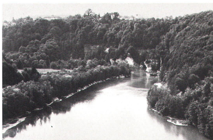
Le plan d'affectation permet de distinguer des zones agricoles, (photo du haut: Emmental), des centres urbains (au milieu: St-Gall), des réserves naturelles (en bas: la Sarine), etc.

Die Nutzungsplanung ermöglicht es, Landwirtschaftszonen (Bild oben Emmental BAR), städtische Kernzonen (Bild Mitte St. Gallen, Swissair), Naturschutzgebiete (Bild unten Saane FR, Baumann) usw. auszuscheiden