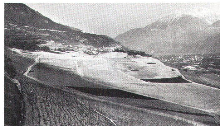
Terrain «assaini» pour la viticulture, près de Varonne (VS): une étendue désertique.

Vielfältige, artenreiche Kulturlandschaft bei Salgesch VS. Durch Rekurs wurde die geplante Rebbergmelioration einstweilen gestoppt.