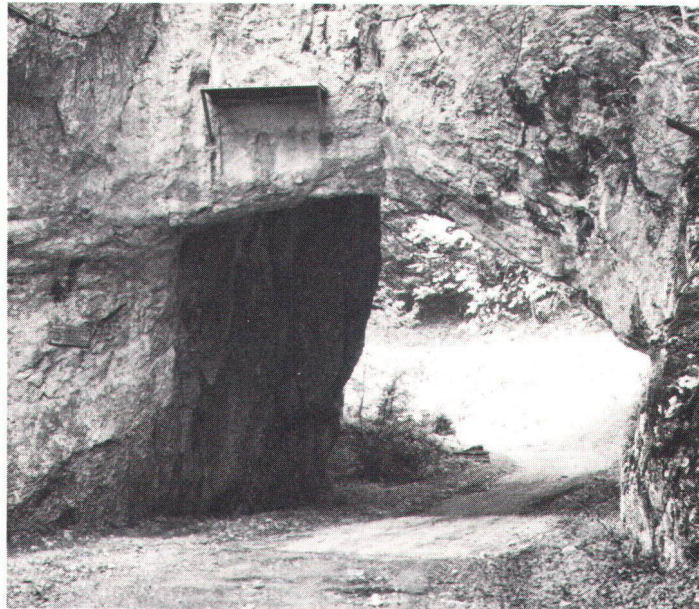
Pierre Pertuis, ein bereits in römischer Zeit angelegter Strassentunnel im Jura.

Fondation suisse pour la protection du paysage