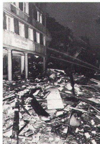
Innert weniger Monate sind die alten Städtchen von Wiedlisbach (links) und Lichtensteig Grossbränden zum Opfer gefallen (Bild & News)

En quelques mois, les vieilles cités de Wiedlisbach (à g.) et Lichtensteig ont souffert de graves incendies.