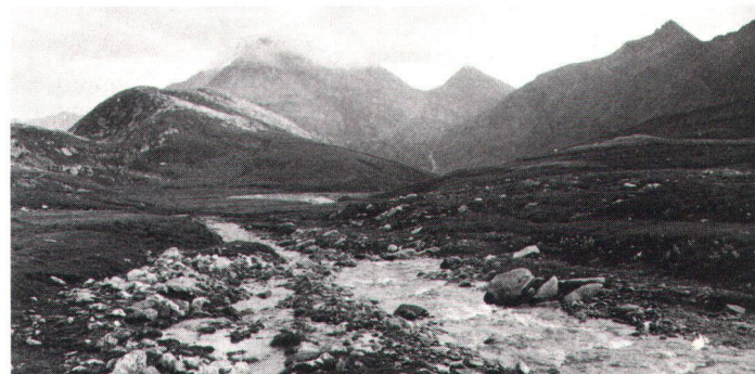
Alaska? Antarktis? Das Greina-Gebiet erinnert stark an nördliche Landschaften.

Der Bundesrat wird zudem eingeladen, einen Bericht über die Schutzwürdigkeit dieses Objektes zu erstatten, und zwar sowohl in landschaftlicher als auch in ökologischer Hinsicht. Zu berücksichtigen ist sodann der naturwissenschaftliche Wert des Gebietes, namentlich aus geologischer, hydrologischer, botanischer und zoologischer Sicht.