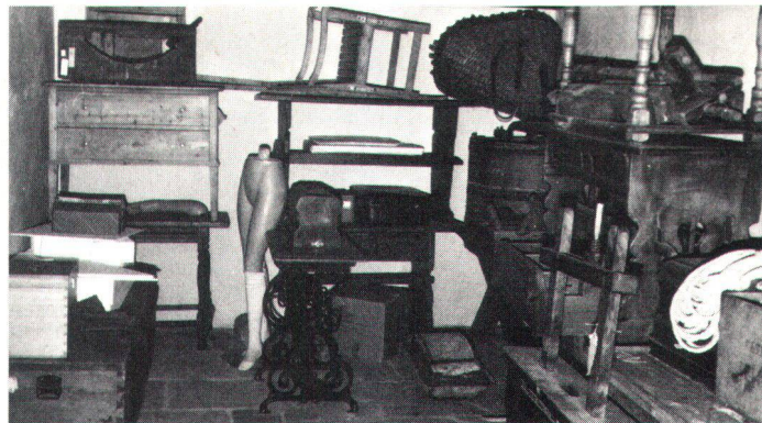
Die Schaffung von genügend Depoträumen und das Anlegen von Studiensammlungen ist in den meisten Ortsmuseen bis heute Forderung geblieben.

Ganz allgemein stehen dabei Fragen der Inventarisierung, Restaurierung, Konservierung, Sicherheit und Präsentation im Vordergrund. Erfahrungsgemäss nimmt diese Arbeit an Ort und Stelle den breitesten Platz im Aufgabenspektrum eines regionalen Museumskoordinators ein. Weitere Hilfeleistungen bei der Einzelberatung wären etwa das Aufzeigen von Wegen bei der Finanzbeschaf-