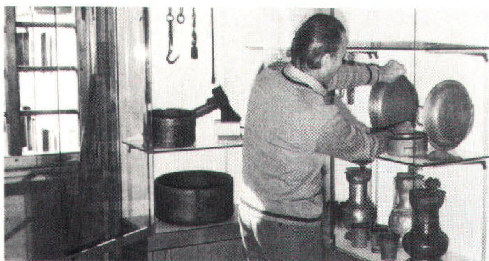
Trotz meist ehrenamtlichen Konservatoren sind die Betriebsaufwendungen für ein zeitgemäss eingerichtetes Kleinmuseum recht hoch.

Même avec des conservateurs le plus souvent bénévoles, les frais d'exploitation des petits musées de conception moderne sont très élevés.