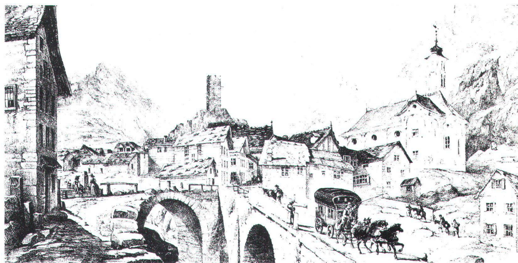
Hospental au temps des diligences, d'après une ancienne gravure. Hospental während der Postkutschenzeit nach einem alten Stich.