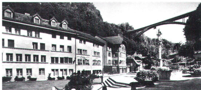
La rue des Forgerons en 1870 (en haut), et aujourd'hui après d'importants changements, spécialement dans la structure intérieure.

Die Rue des Forgerons um 1870 (oben) und heute nach starken Veränderungen insbesondere der inneren Strukturen.