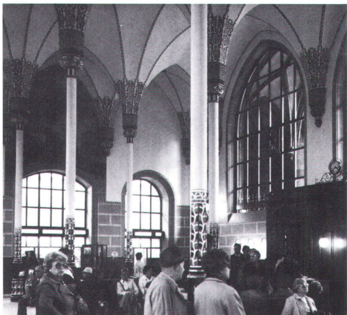
Einsichtige PTT: die neugotische Schalterhalle der Hauptpost Basel überstand den Umbau unbeschadet.

PTT bien inspirés: la salle des guichets (néogothique) de la poste principale de Bâle a survécu aux transformations.