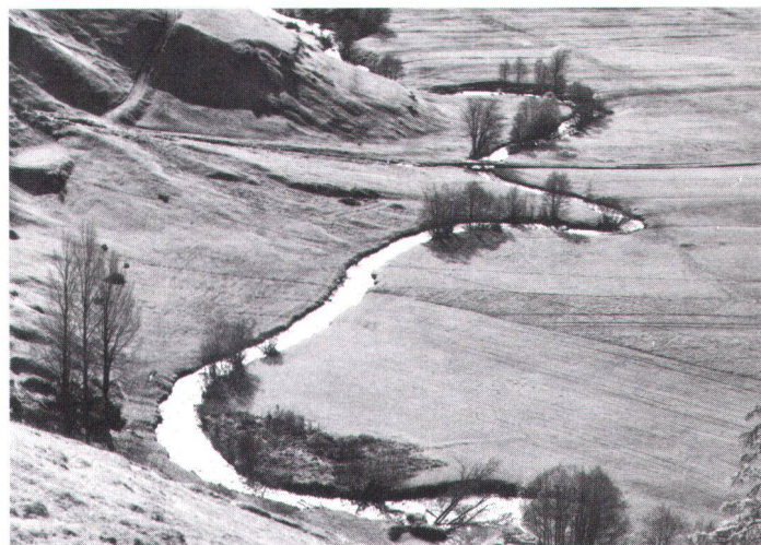
Zerstörung des Landschaftsbildes und natürlicher Lebensräume: der unkorrigierte Rombach bei Fuldera (GR)...

laufend mit natur- und heimat-schützerischen Zielen kollidiert. So etwa beim Nationalstrassenbau, wo er als Bauherr auftritt und damit direkt über dessen Ausführung und Gestaltung entscheidet. In der Planung, wenn er beispielsweise regionale Entwicklungskonzepte genehmigt und damit entscheidende Weichen für die bauliche Entwicklung der betroffenen Gebiete stellt. In Konflikt gerät der Bund weiter im ganzen Bereich der Energiepolitik oder als Konzessionsstelle von Flugplätzen und Bergbahnen, ferner als Subventionsgeber bei landwirtschaftlichen Meliorationen und in der Wohnbauförderung. Stolperdrähte finden sich auch immer wieder – wie jüngst die Kontroversen um den Petit Hongrin und um Rothenthurm veranschaulicht haben – im Zusammenhang mit den Waffenplätzen für die Armee. Ein Kapitel für sich sind schliesslich unsere staatlichen Betriebe wie die Schweizerischen Bundesbahnen oder die PTT, deren Infrastrukturbedürfnisse dem Landschafts- und Ortsbild oft erhebliche Opfer abverlangen und die vom monumentalen Rangierbahnhof bis zu den Normvorschriften für Briefkästen reichen. Auf Kantons- und Gemeindestufe sieht es nicht besser aus, wenn wir beispielsweise an deren Defizit bei der An-