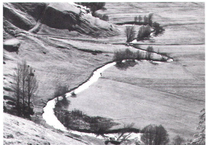
Zerstörung des Landschaftsbildes und natürlicher Lebensräume: der unkorrigierte Rombach bei Fuldera (GR)...

laufend mit natur- und heimat-schützerischen Zielen kollidiert. So etwa beim Nationalstrassenbau, wo er als Bauherr auftritt und damit direkt über dessen Ausführung und Gestaltung entscheidet. In der Planung, wenn er beispielsweise regionale Entwicklungskonzepte genehmigt und damit entscheidende Weichen für die bauliche Entwicklung der betroffenen Gebiete stellt. In Konflikt gerät der Bund weiter im ganzen Bereich der Energiepolitik oder als Konzessionsstelle von Flugplätzen und Bergbahnen, ferner als Subventionsgeber bei landwirtschaftlichen Meliorationen und in der Wohnbauförderung. Stolperdrähte finden sich auch immer wieder – wie jüngst die Kontroversen um den Petit Hongrin und um Rothenthurm veranschaulicht haben – im Zusammenhang mit den Waffenplätzen für die Armee. Ein Kapitel für sich sind schliesslich unsere staatlichen Betriebe wie die Schweizerischen Bundesbahnen oder die PTT, deren Infrastrukturbedürfnisse dem Landschafts- und Ortsbild oft erhebliche Opfer abverlangen und die vom monumentalen Rangierbahnhof bis zu den Normvorschriften für Briefkästen reichen. Auf Kantons- und Gemeindestufe sieht es nicht besser aus, wenn wir beispielsweise an deren Defizit bei der An-