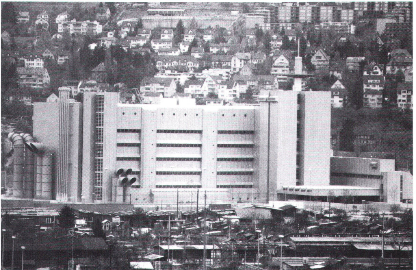
Überrückiger Nachbar der Schrebergarten-Häuschen in Zürich-Herdern ist das PTT-Fernmeldezentrum. Le centre PTT des télécommunications, à Zurich, énorme voisin de la zone des jardins potagers.

Der Staat erfüllt in der modernen Gesellschaft eine wichtige Ausgleichsfunktion. Er hat unter anderem dafür zu sorgen, dass gegensätzliche Interessen nebeneinander leben und sich entfalten können. Sein Pflichtenheft ist dabei die Verfassung. Wie ernst nimmt er diese, wenn es darum geht, unsere Heimat, unseren Lebensraum zu schützen und menschenwürdig zu gestalten? Die Bilanz ist nicht nur erfreulich.