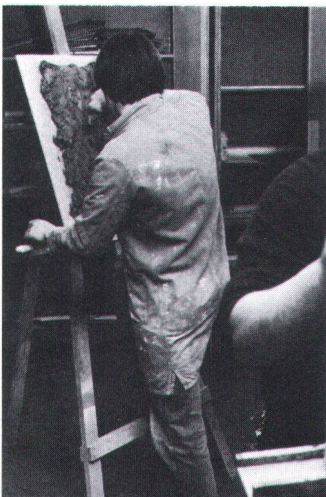
Ein Steinmetz beim plastischen Gestalten Graveur sur pierre préparant un moulage.

La situation de l'emploi, dans cette branche, est bonne, en grande partie du fait de la vague de restaurations: celles-ci représentent 80% des commandes.