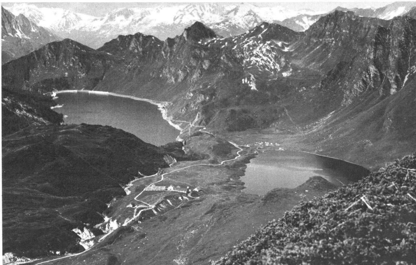
Le Lago Ritom et le Lago Cadagno, au cœur du futur Parc alpin, sont sertis dans le magnifique paysage de la Léventine supérieure.