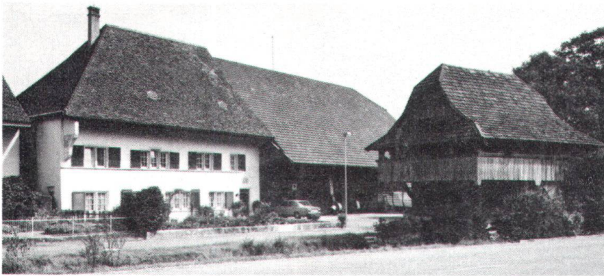
Untervogtshaus und Speicher Ramsseyer in Neuendorf: vor einer gesicherten Zukunft? (Bild Jaeggi).

ton und der Gemeinderat für die Gemeinde das Mittel der Schutzverfügung , mit dem die Behörden im Einzelfall namentlich Bau-