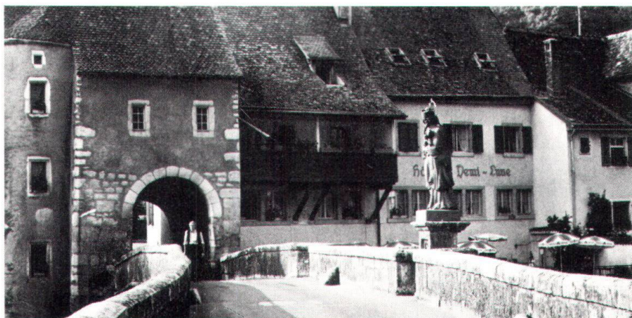
Die Porte Saint-Jean mit der Doubs-Brücke von 1728 und der Statue des Heiligen Nepomuk.

Die geographische Randlage von Saint-Ursanne hat die wirtschaftliche Entwicklung der Gemeinde in den letzten Jahrzehnten stark gehemmt. Das widerspiegelt sich auch in der Bevölkerungsstruktur. Von den 1000 Einwohnern steht der grösste Teil in der zweiten Lebenshälfte, und die Ortschaft zählt nur noch fünf aktive Landwirte. Dafür finden hier rund 350 Menschen in kleinindustriellen Betrieben Arbeit, wovon nicht wenige Grenzgänger aus dem nahen Frankreich. In der Altstadt stösst man zudem auf ein lebendiges Gewerbe und einzelne Handelsgeschäfte . Umgekehrt leidet gerade die Kernzone an akuter Überalterung, weil die jüngeren Bewohner in neueren Bauten an der Ortsgrenze leben. Diese Entwicklung ist nur abzufangen, wenn die Altstadthäuser renoviert und neuzeitlich eingerichtet werden.