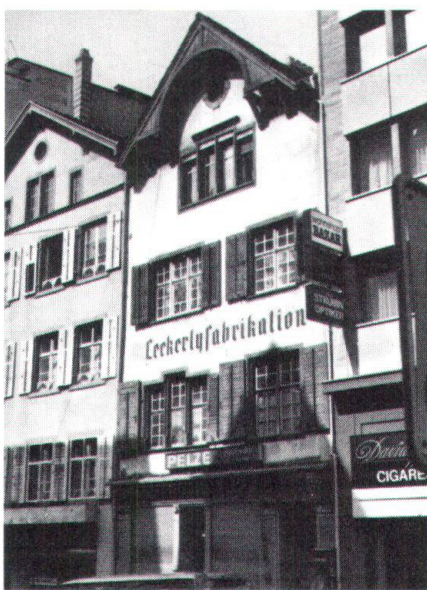
Der Spitzhacke zum Opfer fallen soll auch das «Leckerli-Haus» in der Steinvorstadt, dessen Grundsubstanz auf die Gotik zurückgeht.

Mit dem Abriss des «Houses zum Sodeck» an der Freien Strasse Anfangs 1976 schien jedoch innerstadts der Zenit der Abbruchwelle überschritten zu sein. Die denkwürdige Abstimmung über die Markthof-Überbauung (siehe «Heimatschutz» 1/77) und auch diejenige über die Renovation der 40 Altstadt-Liegenschaften im September 1976 zeigte allen Beteiligten, dass die Basler Bevölkerung nicht gewillt war, die oft scho-